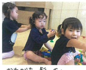
お友だちの髪の毛に ブロックでヘアアレンジ