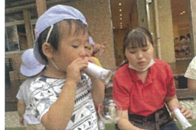
やさしく、なーと シャボン玉でました