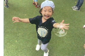
先生が作ったシャボン玉を 角虫ってニコニコ