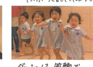
ダンスは、笑顔で 全力でした