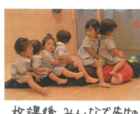
放課後、みんなで先生の 背中に座ってみました