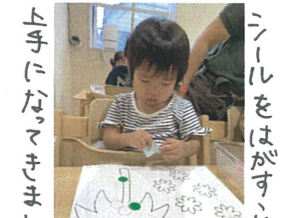
上手にならまきました。 ニールをはがすことが