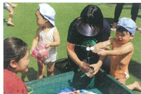
先生とお水の掛け合いが 顔に当ててるのが上手い