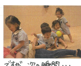
ですが、次の瞬間... ほぼ全員落ちたよ (笑)