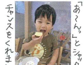
「あ〜ん」とシャッター