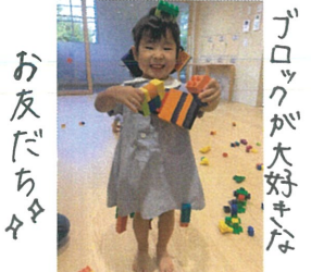
お友だちが 全身にブロックを たくさん付けました。