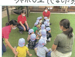
今日は、園庭で非難訓練をしました。園に戻る時も真面目です。