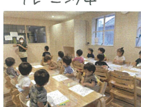
先生の説明を聞いてから シールあそびスタート