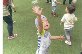
一生懸命、腕を 伸ばして、タッチ☆