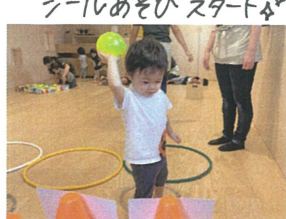
白濁をよ〜く見て、ボールを手から、放して投げられるようになってきました