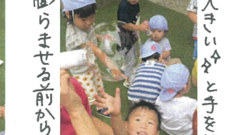
膨らませる前から、割られそう汗 大きいかと手を伸ばして