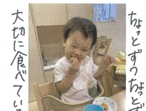
ちんとずりちんとずり