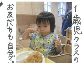
大切に食べていました