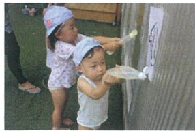
夢中になっていたり、どんどん 白濁の近くに... (笑)