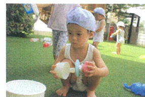
次は、何をしようかな。 玩具を見つめて考え中。