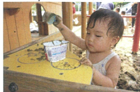
砂場の奥の台所で 集中して、お料理中