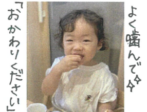
「おかわりください」と 言えました