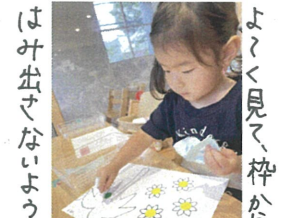
よく見て、枠から はみ出さないように 真剣な表情です。