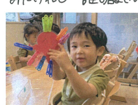
「できたよ〜」といつも、一番 大きな声で教えてください。