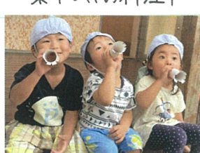
シャボン玉のイメージ トレーニング中