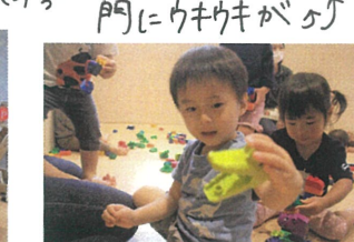
お友だちも自分でパクッ 1歳児クラスの