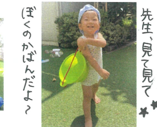
ぼくのかばんだよ 先生、見て見て カメラに向かって キメポーズをしてくれました