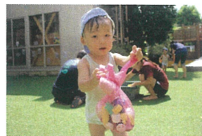
見て見て ~ ♪ いっぱい見つけたよ