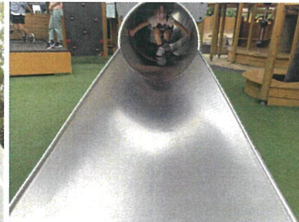
スライダーからキャッチー! カメラを向けるとヒール♡