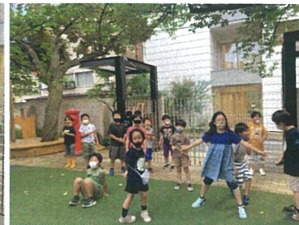
あとは6年生だけ! 頑張れ~!!