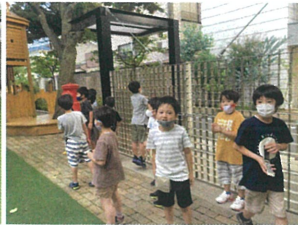
気が付くと...穿屋が パンパンに