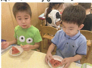
この日のおやつはスライ。(+おせんべい) 夏を感じながら美味しくいただきました。