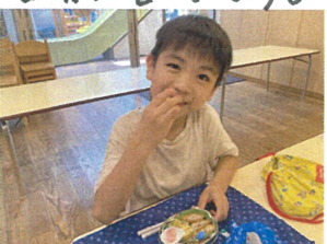
この日はお弁当でした。みんなとても嬉し そうで、可変りしかったです♡ありがとうごさいます。