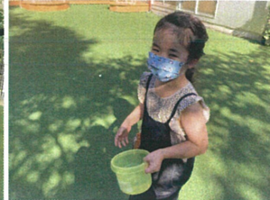
夕方からでも「水遊びしたい!!」という リクエスト☆バケツで少しだけ水遊びをしました。