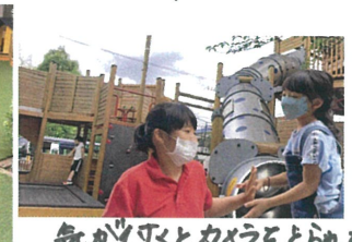
気が付くとカメラを向けると パシリで来てました(笑)