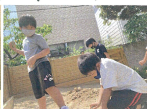
山を壊そうとする者...、泥団子を作る者... 砂場には様々な遊びが展開しています。