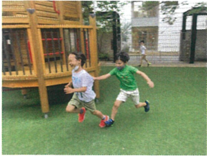
園庭に出れば、突然始まるドロケイ☆ 門の前が穿屋なのは、暗黙の予解々々