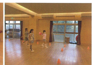
サポーターがおわると、 「トッポボールしていい...」