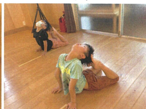
ブリッジ!! 1年生は 身体がやわらかいぞ☆