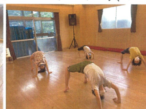
負けじと上級生も がんばっていますよ!