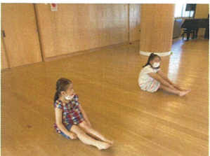
柔道体操は、1年生と 上級生ペアで矢張り役をお願いします。Fight!