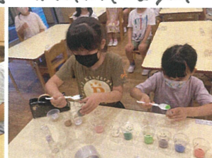
砂時計(風が止む)を作りました。 色の組み合わせは〇!