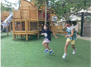
スキップ対決☆ 勝者は...?!?!