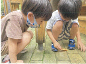
園庭にはさまざまな動植物が。小さな虫と 見つけて、みんな興味津々(〇)多