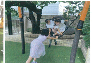
やはりゴーストは、 激しく! 楽しく!!