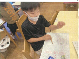
作文は、まずは1ページ 目標に書いています。