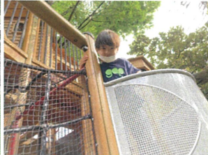
2階から、ヤッホ〜! 笑顔がステキです♡