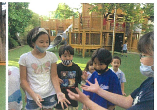
時には、ルールの見直しを します。もちろん、話し合!!