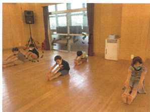
ひだりあしからスタート!