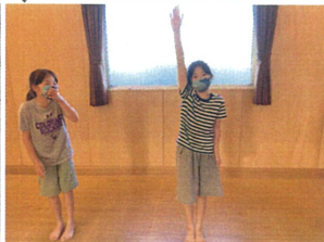
お隣を見て 思わずニヤニヤ☆