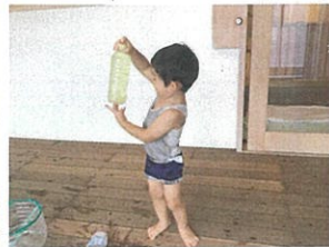
/Shake Shake!! 「おいしいジュースになあれ」 お水をたくさん使ったかな?