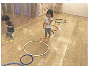
大きな輪、小さな輪 交互にびよ〜ん 渡ります! 向こう側へお届け ♪