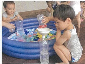
「じょうご」を使って お水をたくさん使ったかな?