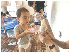
できあがった特製ジュース うさぎさんへどうぞー ♪