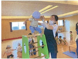
マットを目指して /ひそ〜んっ \