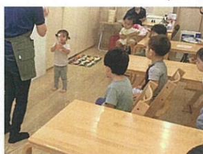
♪色水あそび♪ 「お手伝いしてくれる人ー？」 に真っ先に手を挙げてくれました!