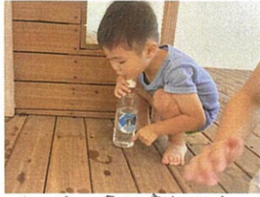
水で床の色が変わるのを