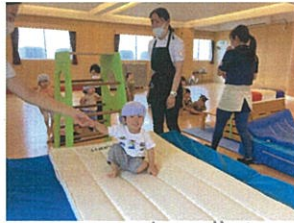
やったー ジャンプ成功!! 素敵な笑顔です♡