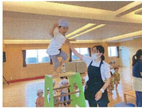
/せーのっ ジャンプ!! 高く飛びました ♪