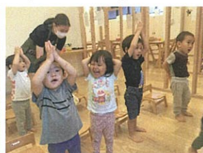
バナナ ♪ に変身中 ☆ 「お手伝いしてくれる人ー？」 に真っ先に手を挙げてくれました!