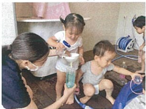
水を足すと薄い色に ♪ きれいなブルーです ☆