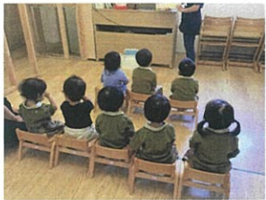
ルルクラス ベリルクラス 合同で朝の会を行っています☆