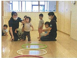
「ハイッ」スタート前の お返事もバッチリです♡