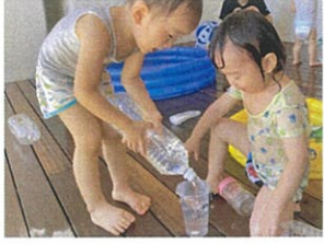
「どうぞどうぞ〜」 豪快に注いでいます☆

日に日に完成が早くなってきました！😊 真剣に取り組んでいます!! 一目散に集まる子ども達♡ 発見☆ お水お絵書きしよう! ちよとすつちよとすつ... 流!