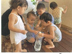
小さなブルブルのお友達に