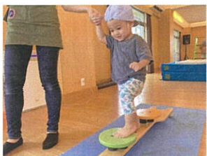
グラグラするけれど そーっと1歩ずつ進めました! 思いきり走りました ☆