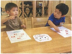
赤いシールでさくらんぼ ♪