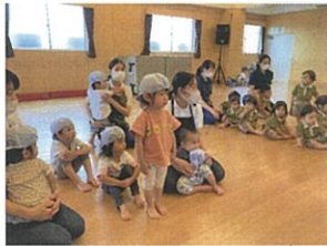
Pearl Nursery Schoolのお友達と 3Fで合同サーキットを行いました