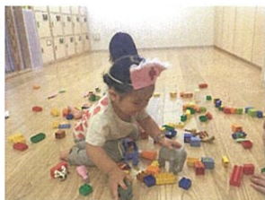
ナースになりながら ブロックにも夢中 ♪