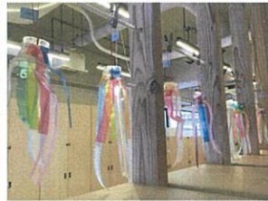
ユラユラ揺れる クラゲ風鈴が出来る上がり♡