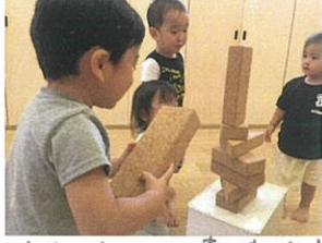
すごいバランスで積みあげました☆ まだいけるかなー!?!?