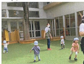
夏休み中の&幼稚園。 思いきり走りました ☆