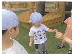
セミとごんにはほ 優しく触れる事ができたね! 持ち方レクチャー受けました♡