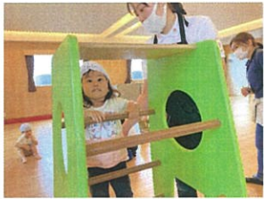
頂上まであと少し!! 全身を使って登りますよ☆