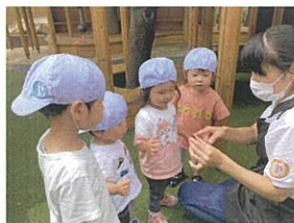
ここを優しく持って... 持ち方レクチャー受けました♡