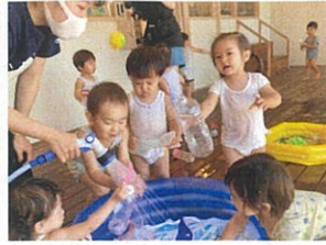
ミャワーからお水を出すと