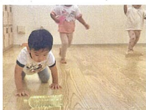
ゆっくり転がるボトルの重み おもしろいね ♪