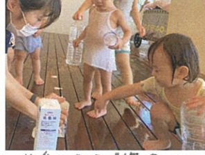
牛乳パックで作った