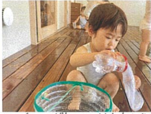
口の糸目ボトルにお水を入れています

日に日に完成が早くなってきました！😊 真剣に取り組んでいます!! 一目散に集まる子ども達♡ 発見☆ お水お絵書きしよう! ちよとすつちよとすつ... 流!