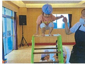
少し高くてドキドキ♡ でもそれが楽しいっ♡