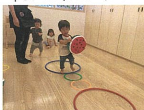
今度はスイカを持って、 8月の歌も1/1111でお花