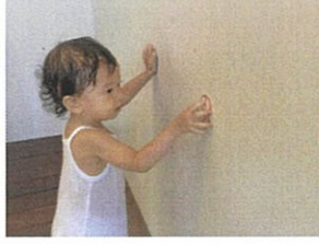
♡♡♡ KO KO 壁にお魚がくっついた♡