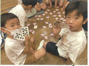
この日のサイエンスはヨウ素(イガ、薬)を使った実験を行いました。ヨウ素 + ビタミンC (この日はレモン汁) を入れると... 透明になりました!! 神経衰弱... 1年生も奮闘しました。 この日環境に上達しています。