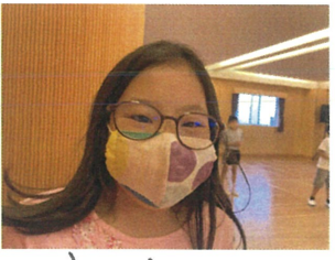
この日は紙飛行機線の制作。 イッ～!! 投げ方にも工夫して... 恒例のBSCとのドッチボール。 カニやこちらは ジャンプボール、緊張します!! ピースの余裕が笑 うわあ! アップで失礼します!