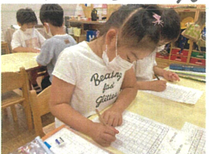
クワガタタイム... みんなの姿勢や目線がとて素敵です。音読では、"きちんと自分ができるか?" 声の中で問いながら音読します。 マス計算のくり上がりは難しいですが、真剣です。