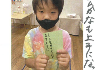
七夕の製作は星飾り☆全員で力を合せて それぞれの思いを込めて... 短冊を書きました。作りあげました。山折り、谷折りが難しいようですが みんなの願いがこめられますように...