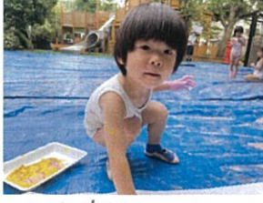
ん!! 先生、ズに10月、タンゴしてもいいの?