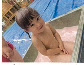
先生... 入ってもいい?! 露天風呂おたいたね♡