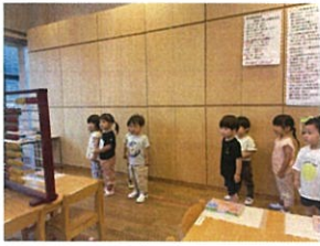
年長さんのお部屋におじゃまして... 100玉ごそろばんて10まで数入ました!!