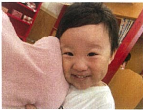
ハートのクッションを見つけてアタの代わりにキミ♡♡