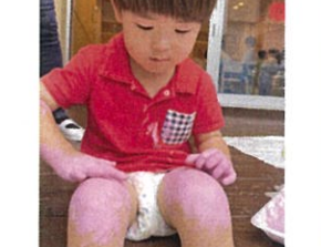
ぬりぬり... ツツサ〜ジ! たい!!