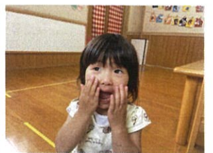
お友だちと歌をうたうのか? 大好き♡ 先生、ピアノが素晴らしい!