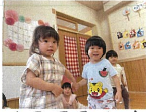
女の子、男の子のコンビで2人です!!!