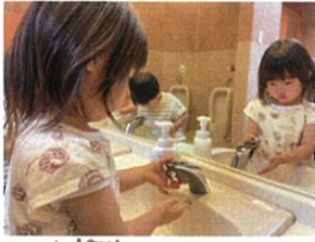
ココを押すのがは...? 止まらな一い☆