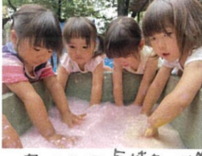
あ、たかて気持ちいい♡ お風呂おたいたね。