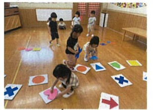
型ハハ競争走にチャレンジ!! どれにしようかな...