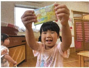
先生、ポットティエを持ってきてよきこれおたしの♡