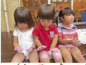
もー、自分の体に塗らる☆