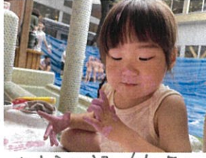
あ、お顔の絵の具を取ろうとして... とんどん付いたら!!