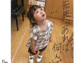
年少さん2Fのお音階で天まで発見!!