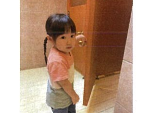
先生、トイレに行きます!