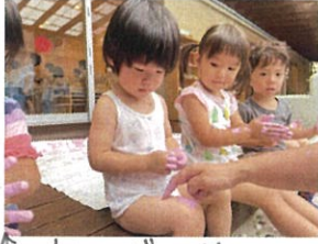
先生... ポクの体に何をあそぶの... ♪