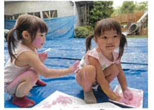
お友だちに付けちゃえ☆ かわいくしてネ♡