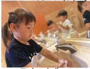
年少園舎の水道はなんと自動でお水が出てきま☆