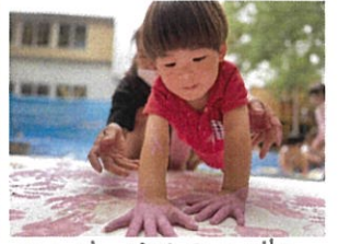
フリンガー-ポイントングに夢中☆