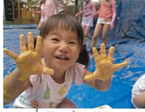
先生、きれいな手、かわいいね☆