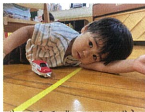
ポク... 電車であそびながらひと休む...