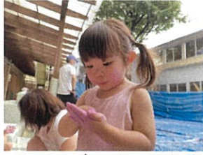
私は... ホッパにハッパ!! お化粧しているみたい。