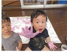
おあ... 先生!! お手てに付いたらあつたよ!!