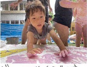
ボクもやる!! 自分で決意し実行です!!