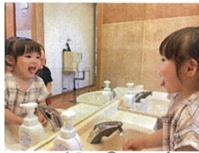
自分の顔を見ながら手洗いは楽しいな☆