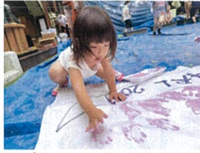
初めてのフリンガー-ポイントング!! 私、早くやりた〜い!!