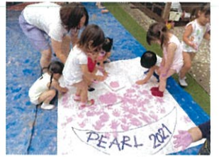
10月・10月・10月、タンゴ!! かわいらしい手型がいっぱい♡