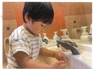
あ!! お水が出てきたよ!! 急いで洗わないと... ♪