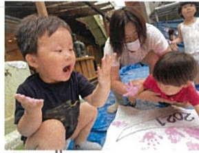
先生、しっかり持っててね...