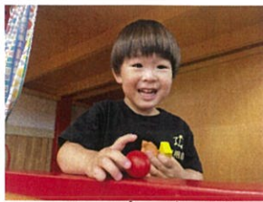
コロコロの車が回るよ!! ねてておこる