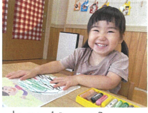
どこもカラフルよ やきそばの出来上がり!!