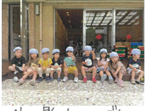
外は暑いね...でも 早くあそびたい!!