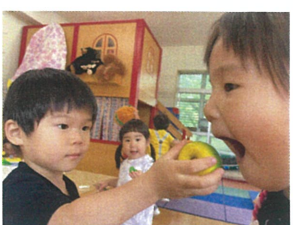
私もりんごを食べたい!!