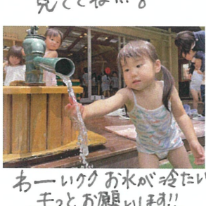
あーいっく お水が冷たい!! もっとお欲しいです!!