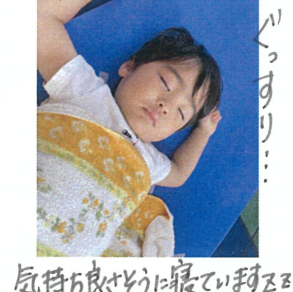
気持ち良かったので寝てしまいました