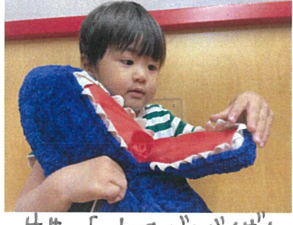
先生...「これはジンバイゲム」 なんだよ!! 知ってた?!