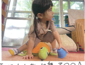
私はカメジに乗って〇〇