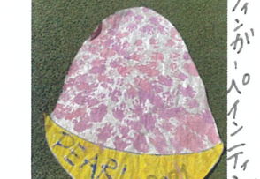
お友だちのかわいい手型が かき水にはりました!!