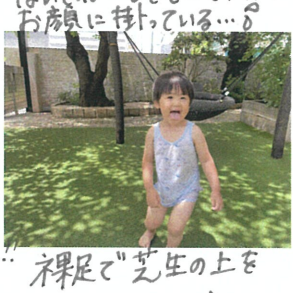
裸足で芝生の上を 走り... きもちいいよ