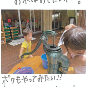
ボクもやってみたい!! 初めにコトにお水を入れて...