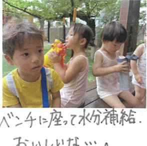
ベンチに座って水分補給。 おいしいな...