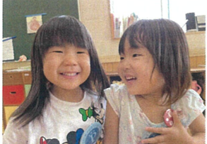
3さいになるとお姉さんになるのが 楽しみだね