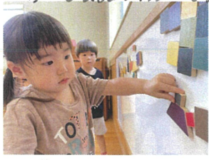
四角・三角・台形を くっつけたら...出来たよ!!