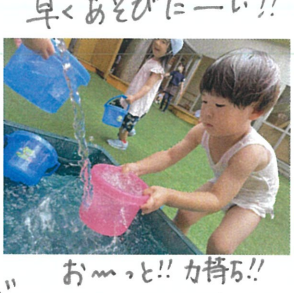
お...!! カサカサ!! お水はおもていて...