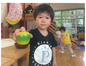
先生もりんごをどうぞ!! いただきます