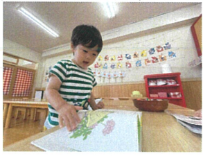
ありえはどニに行くのかな? あっ、いた!! おかしが大好きなんだって...ビスケット食パンに乗ったネ。