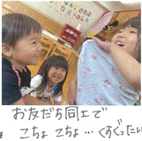
お友だち同エで こちこち... くらたいさ