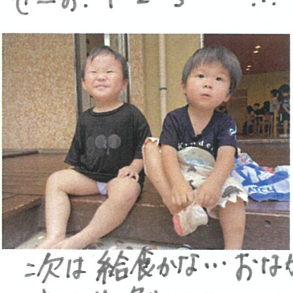
次は給食かな... おはか すいた!! 急がないと...