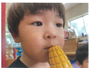
ホクは... とうもろこしが大好き!