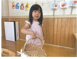
お買い物に行きますよ 何をかおうかな...