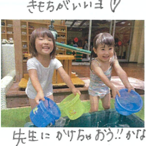
先生にかけられよう!! かな... せーの. 1. 2. 3. — !!