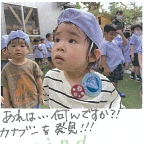
あは... 何ですか?! カナンを発見!!