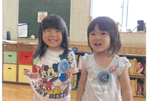
夏休中に3さいになる お友だち!! 石権かに!