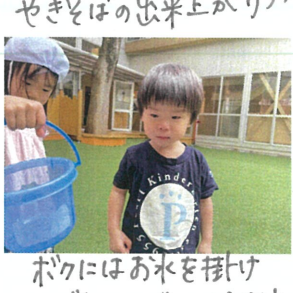
ボクにはお水を掛け たいね...でも...もうお水が お顔に付いている...