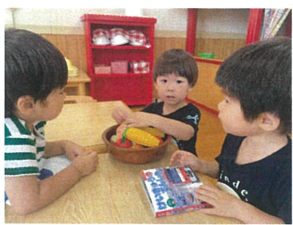
何のゴハンが好き? この電車に乗ってある?! ちゃんと会話が成立してます