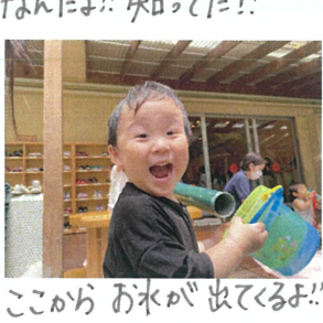
ここから お水が出てくるよ!! 見てね...