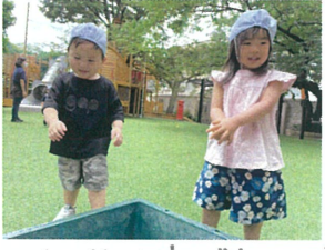
あ!! お水が入っている! きもちいいよ