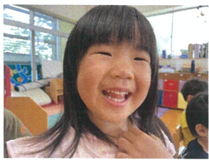
先生、おはようございます!! あれ!! いももちがうイースタイル