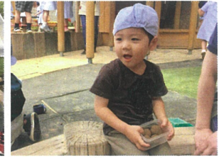
お団子は いかがですか〜?