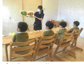
レチレチクラス、初めての “のりの三番勝負”でした!