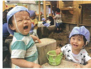
お友だちと一緒だと 楽しいね♡(にこにこ!