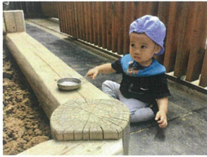
さあー！お砂で 何を作ろうかな??