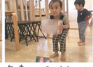
知育あそびのお片付け。 ありがとう♡