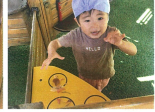
お家で遊ぶときは、 靴を脱ぐんだよね♡