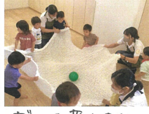
ボールを落とさない ように気を付けて〜!!