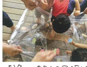
お魚やキラキラアイテムも どんどん入れるよ〜♡