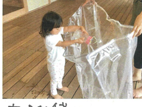
大きな袋に お水を入れて……