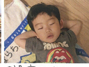
お昼寝したら… また遊ぼうね☆