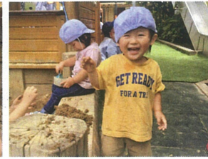
手が、石少みれに な、ちと、にあ〜♡