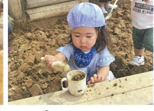
コップに石少を サラサラ♡