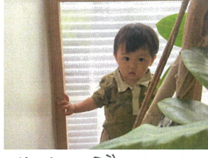
かくれんぼしている人 発見したら、にこにこ