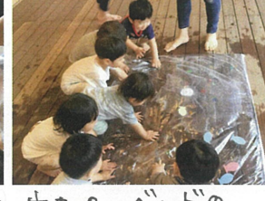
ウォーターベッドの 完成です!(^^)!