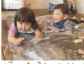
コロコロもできます♡ フワフワユラユラ〜☆