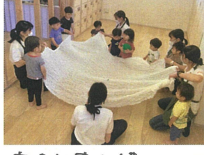
大きな布を使って 遊んでみました♡