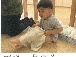
ズボン、自分で はけるかな〜??