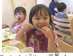
マスカットゼリーが美味し くて、この笑顔♡