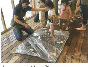
ウォーターベッドの上を ゆっくり滑、ってます♡