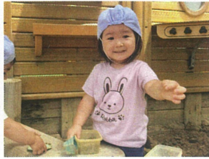
(はいっどーそ♡ お砂のツブツブです!