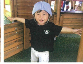
いら、せいませ〜☆ 葉、ぽんぽんとすよ!