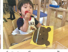
くまさんではなく、ボクが 食べちゃおうと♡