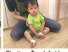
靴下を履く練習を 始めました♡Fight!