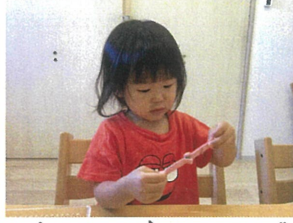
ベリル知育は…ポタンに お水を入れて、ちよ、 ぷりぷり楽しいけれど、 諦めずには頑張りなね!