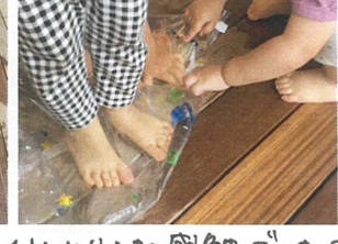
ひんやりした感触でした♡