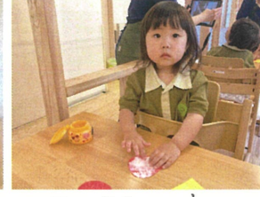
小さな丸ミール… 見られるかなあ〜?!