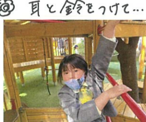
「ツリーハウスの3階に行くってね〜」