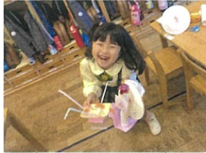
自由に作る中でも、子どもたちの思わぬ発想に 驚きと成長を感じています♡ ステキ♡