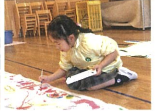
ここは〇〇色で...と こだわって塗っています♡