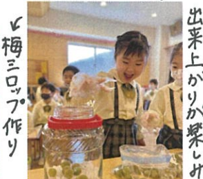
「梅ミロップ作り」 「出来上がりが出来ました」