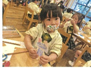
みんなの よく見える 特別席!!