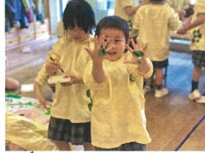
夢中になっていたら、 手が絵の具だらけ♡