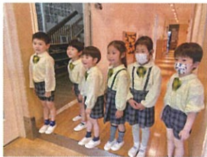
「給食美味しかったです」 「また作って下さいね!」