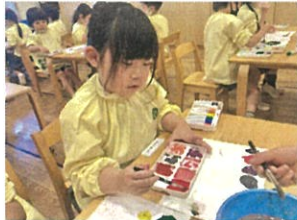
こんな色も出来たよ~♪と新しい発見が あ。たわ!! 何色出来たかな??