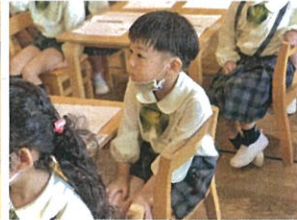
本に与えられた手紙が とっても美しいです♡