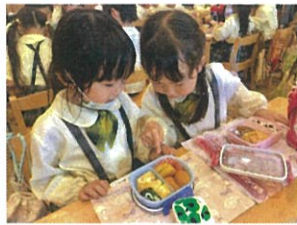
私と同じチキン ナゲットが入ってる~♪