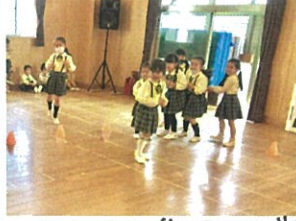
久しぶりの集団あそび♡ "ドングリボウリング Fight!!"