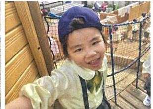
一緒に橋渡ろうよ!!