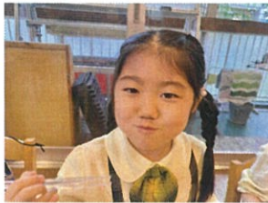
「美味しそうに食べてますよ」