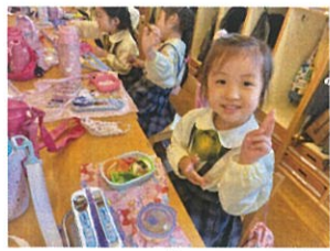
心を込めて作ってくれたお弁当は美味しいね😊