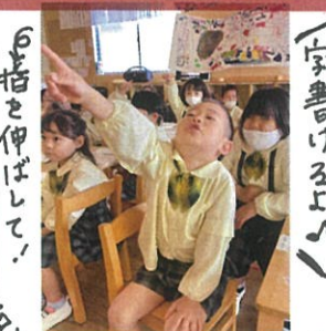
「お箸を伸ばして!」 「エンプラスくさいぞ!」