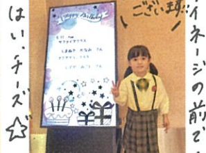
おめでとう ごごい球!! サイ ネー ジの前で...