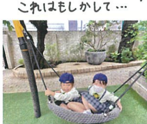
「宇宙に届くように押して下さい😊」