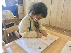
本に与えられた手紙が とっても美しいです♡