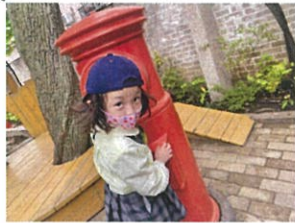
「お日様の光が気持ち〜...」 「何が入っているかな...」 「スパスパ ママ」