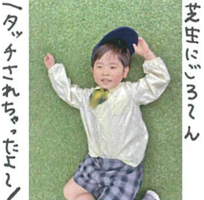
「タッチされたよ」 「一回休憩します」