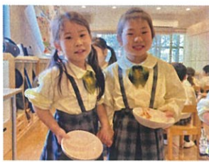
「御代わり行ってきます」 「一緒に行ってくるわね」