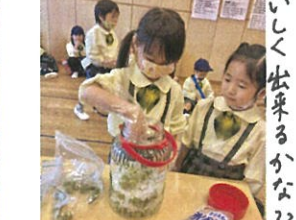
交互に入れていきます♡