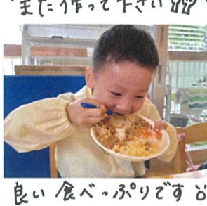
「よく噛んで食べてね」 「良い食べっぷりです」 「美味しかったね!!」