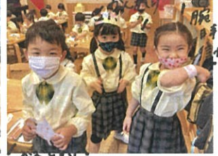
様々な作品が完成☆ 色の混ざり合いを楽しみました