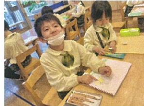
園庭で見かけた ちゅうちょを描いたよ。