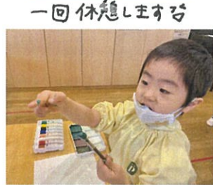
「色が出来上がった!」 「見てね〜」