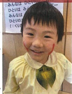
「あー、絵の具を顔につけちゃった(笑)」 「このほりに色を付けました」