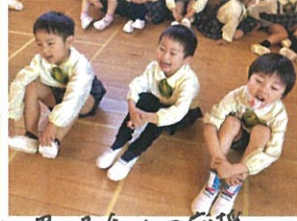
男の子チームの応援 届くかな~??