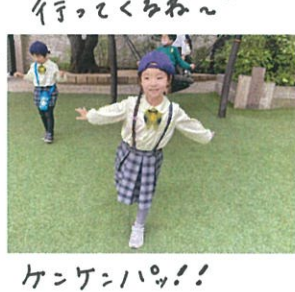
「練習するぞ〜」 「ケンケンハイッ!」 「片足で立てるよ〜」