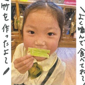
「竹を作ったよ」 「ネゴに大変身」