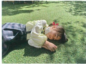
「お日様の光が気持ち〜...」 「何が入っているかな...」 「スパスパ ママ」