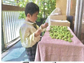
幼稚園で収穫した梅の へたを取っています♡