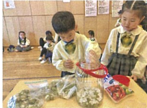
梅シロップ作りには桃葉!! 氷にせた梅と氷砂糖