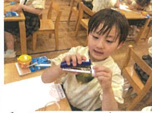
画用紙を使って構成あそびを行いました♡1枚の 画用紙を細長く切ったり輪っかにして繋げたりして...