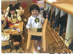
先生の椅子持って 来たよ~!! はい、どうぞ!!