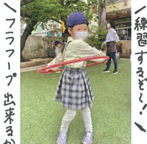
「フーフーフー出来るかな?」 「おレリフリフリ」