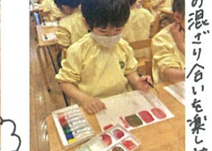
少しづつ色が違うわ!!