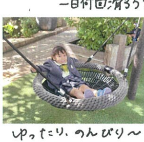
「上がったリ、のんびり〜」