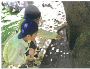
あっ!木の間に1どこ どこに!! ヤモリがいるよ!!!