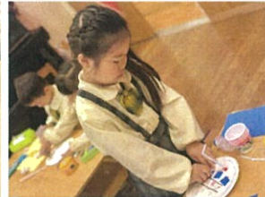
紙皿やカップ、テープで 沢山ご協力ありがとうございました!!