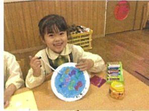
今回のお話はどんな 物語かな~? 1集由!!