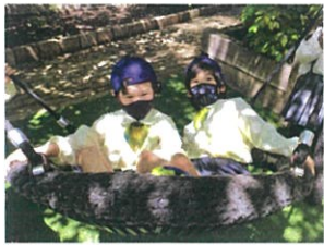
ゆりかごスイング もっと押してください!!