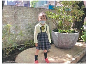
写真撮って下さい😊