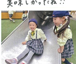
「スライダーが大好き」 「一日何回滑る?」