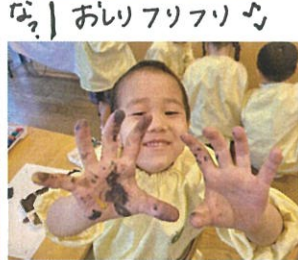
「うわあ〜!!」 「手に絵の具が!」