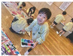
「何色で塗るのかな?」 「カラフルにしよ〜」