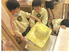
えっ!? こんな色に 次回のお宝を発見