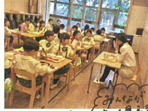
白川先生が給食の 時間に来て下さいました♡