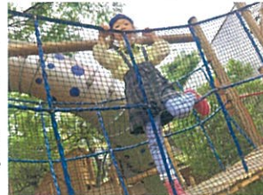
先生~!! いるから 2月に登って来て~♪