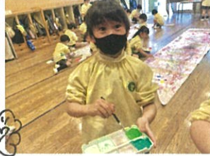
見て~!! こんな色も 出来たよ♪♪新しい発見