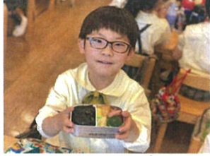
おいしくいただきます!! / 先生の椅子持って ご飯もおかずもぎょうり!!