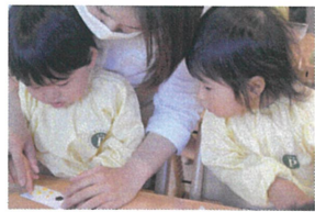
お友だちの姿をじっと見まはして☆