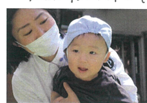
折り返し地点の タービリンに夢中です☆