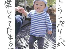
楽しくてたまらない♡ トラニポリニが