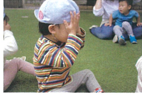
《宝探し》 両目を隠るのが上手☆