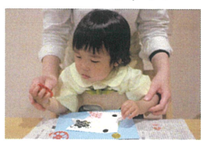
スタンプに興味を 持ってくれていました♡