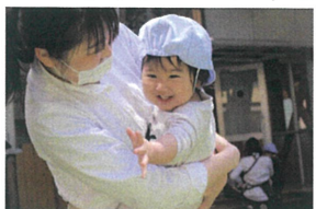
タービリンを見つけて この表情☆