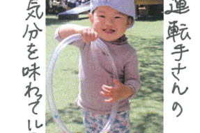
気分を味わってリンリン☆