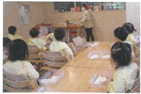
《こいのぼり製作》 みんなで先生の説明を聞いてスタートです☆