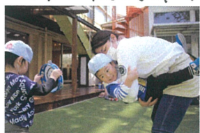
おさるさん♡ 足のチカラがスゴイ☆