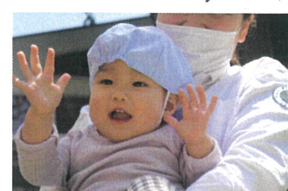
両手で喜びを表現して くれました♡