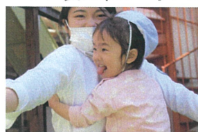
先生が手をはたしても つかまることができませんでした☆