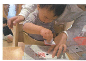
うろこスタンプも☆ 目に重ならないように♡