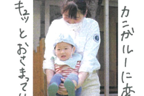
カニガルーに変身 モウとおまわっています。