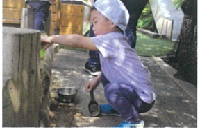
お砂場から出た 砂を積みながら戻してくれました♡