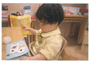
あと少しで完成です☆ ウキウキしていました。