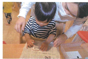
“こいのぼりの歌をうたいながら行いまはして。1歳児クラスのお友だちも先生と一緒にハッピーハッピー☆