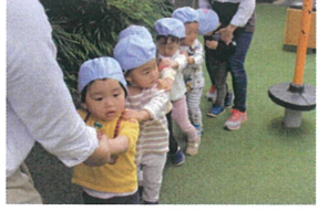
2歳児クラスのお友だち カッコイイ電車で探検☆