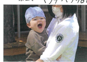
《ふれあい遊び》 ゴアラに変身☆