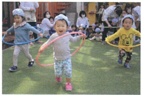
《フーフー電車》 しゅっしょっしょ