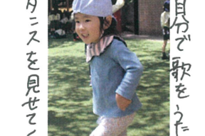
自分で歌をうたいながら ダンスを見せてくれました。