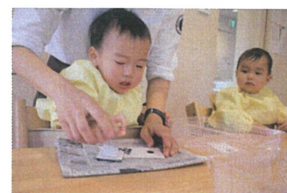
ジャ ジャ～ン☆と先生に見せてくれました