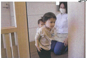
「気をっけ!」が 上手になってきました。