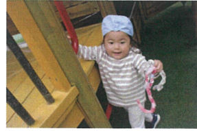
「あ～ん☆」と とても嬉しそうでした。