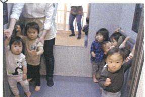
「どうぞお」と言われたお友だち 朝の会は、ノリノリで から、エレベーターに☆