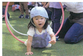
《フーフートンネル》 もう、ハッちゃらです☆