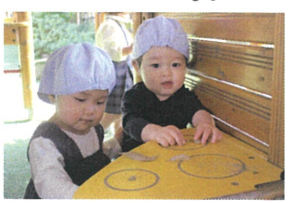
お友だちと一緒に お料理中♡