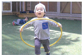
ハイスピードで先生の ペースまでダッシュ～♡