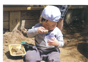
夢中になって遊んでいる姿が♡