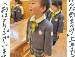
「おはようございます」さんぽ、お礼も忘れず♡