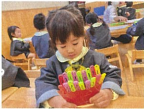
ポテトの完成です。上手にパッチン出来たね!