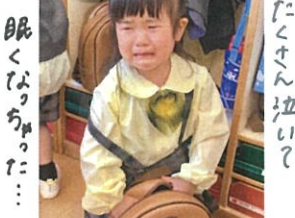
それでも元気でいます♡