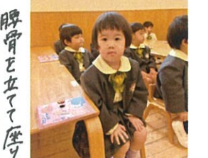
手はおひざで座ります。