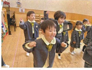
音楽に合わせて1.2.3! いい笑顔です♡