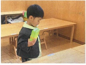
ボウの席お一つづつにのびやかには自分のお一つ覚えてかな?