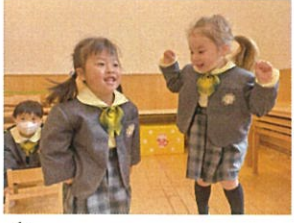
高くジャンプ! お返事と一緒に楽しんでいます♡