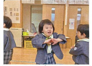
お礼のお返事、お礼もとっても上手に踊ってます!