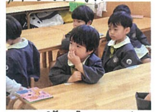
あはは、指を鼻の中に(笑) 面白い、かわいいお返事も見せてくれます!