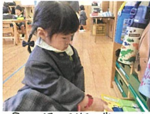
今日は何して遊ぶのかな? 粘り強い、お礼も忘れず♡