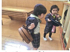
1人でチャレンジ中☆☆ お礼のお返事もとっても上手に踊ってます!