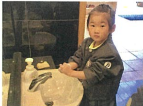
ハンカチを出してから 手を洗おうね**