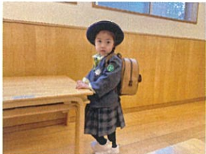
「ママと公園に行きたいの...」 もうすぐバスが来るよ!