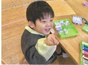
指にくっついてきた! 粘土遊び楽しいね~!