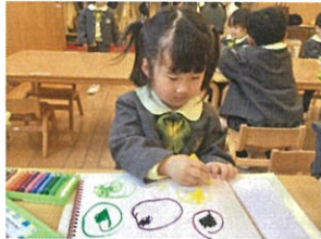
丸を描くのが とっても上手です♡