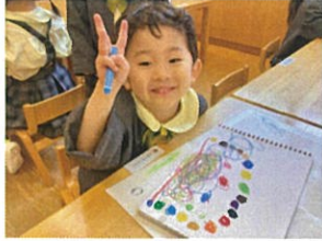
ヒース♡のつもりが... ♡になっています♡