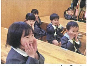
あはは、カメラ、ビデオおめでとう... ほっぺ♡♡