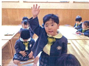
大きき声で言えました! 大きくさん泣いてたよ...