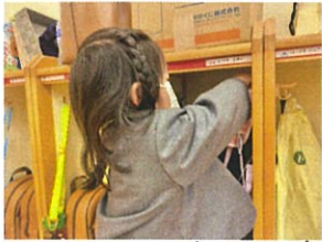
おはようございます。自分でお変度中...