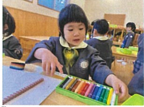
レインボーのすべり台だ〜! クワーンのすべり台だぞです♡