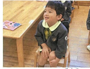
とても Cute に笑顔で お話を聞いてくれていまる♡