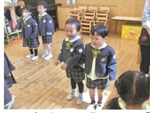
メロウラスのお返事、手を叩いて... お礼のスタート!