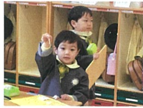
「おめでとう!」にふにふとハッピー♡ 作りものは