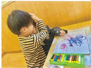
お兄ちゃんがいい。只弟愛にキュン♡