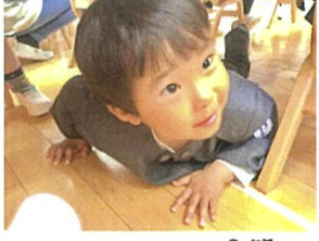
ソングとダンス!! 笑、お礼の「お返事」もバッチリ♡