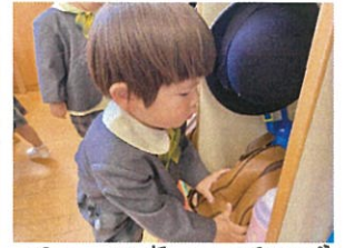
お礼のお返事もとっても上手に踊ってます! 1日覚えてお返し!