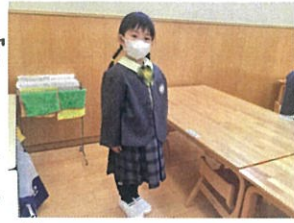
「おめでとう! ハイ!」足も揃えて入ります!