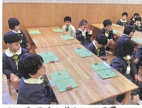
お返事は「お礼を聞くのもバッチリ! 1日覚えてお返し!」