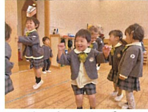
サササ、お礼のお返事を踊りまじり、お礼もとっても上手に踊ってます!