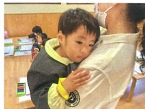
先生に抱っこをしてもらい安バしたキ養子♡