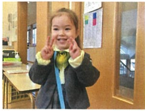
カメラを向くとニコニコ😊 それでピース👋