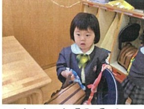
かわいいお返事! お礼のお返事もとっても上手に踊ってます!