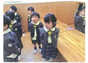
「おめでとう!」を取ると、お礼のお返事、歌がとっても上手なんです!