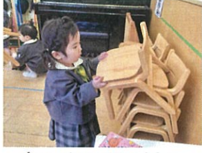
イスの片付けをお手伝い! あはは、お礼♡