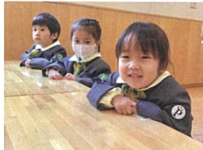
先生とお話中♡ 今日の朝ごはんを覚えてくれたよ。