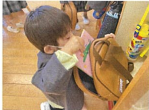
「背中の方に入れよう!!」 伝えたと通りに出来ました!