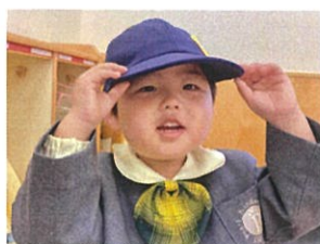
クラスキョウゴを かぶりつけて叶えたよ♡