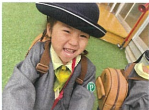
「バスが来たって!!♡」 また来週元気に来てね☆