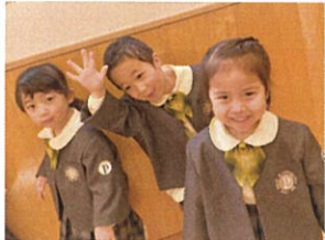
ダンスが楽しくて、 リリリはトパーズクワス♡