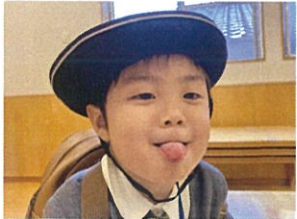
ベー、と変な声♡ お礼の言葉に付いたよ!