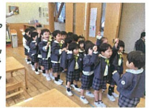
電車によってお礼へ行くと!! お礼で「レッツゴー」