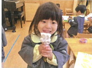
アイスを作ったよ! おいしくできたかな?♡