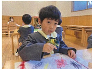
次は黄色にしようか... 赤にしようか...