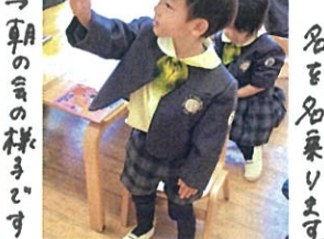
「背中の方に入れよう!!」 伝えたと通りに出来ました!