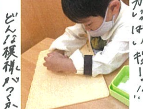
みんな褒められるかな?!!