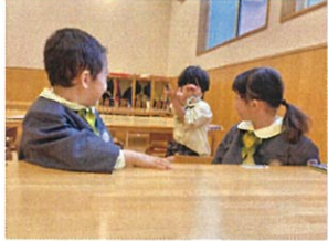
「おわりにくいかもしれない! 3人で大笑いしています♡