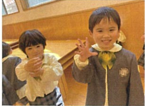
「これからダンス可也ー! と伝えたと、喜んでくれました!