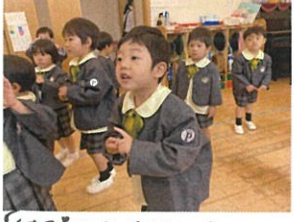
「お返事おめでとう!」お礼のお返事もとっても上手に踊ってます!