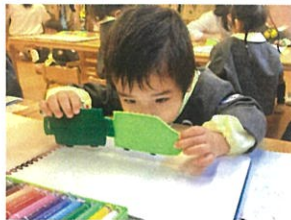
乗り車年輪が走りまーす!! 葛中なようです♡