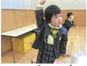
先生の目を見てお返事してくれませんか? フェズ♡