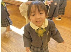
みんなが一緒に ジャンプジャンプ♪