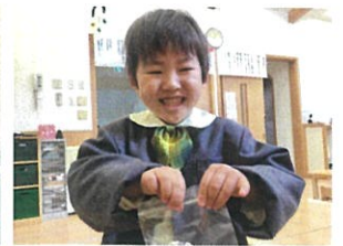
マスクを取るとモッモッかわいい表情が見えます♡