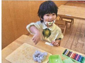
「見てー! 山盛りだよ!」 →朝の音の様子です→