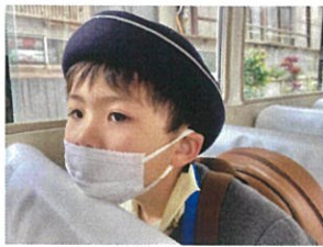
バスの座席にあごを 乗せて叶えたよ!(笑)