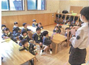
「背中の方に入れよう!!」 伝えたと通りに出来ました!