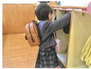
自分のロッカーを覚えて 一人で支度を頑張ってます!!