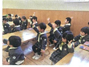
「サゴウラスのお返事!」「(ふーい!♡)」