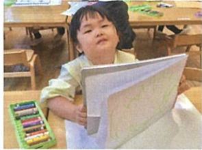
描いたものを取っかきりながら 見せてくれました!(笑)