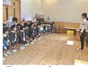
「お返事おめでとう!」お礼のお返事もとっても上手に踊ってます!