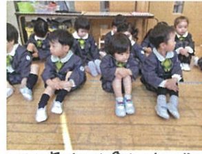
お礼のお返事もとっても上手に踊ってます! 足を動かして、手に拍子を取ります♡