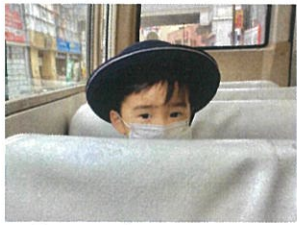
慣らし教育活動2日目♡ おはようございませう♡