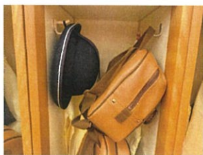
あねね? リムワークも フックに掛けられるよ!(笑)