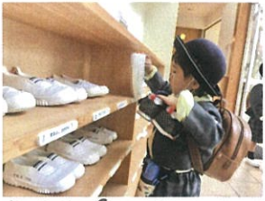
自分で上履き履けるかな? 持ち方が上手なの