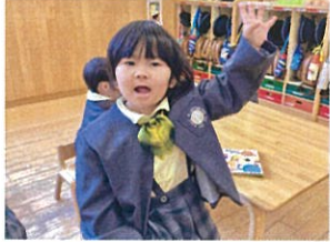
「トキトキしながらも、 上手に言えています♡