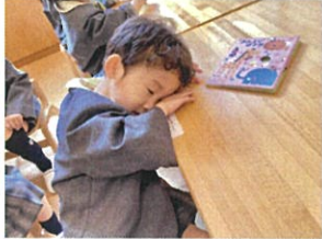
名前を言うのがちょっぴり 耳がずかしくて寝たフリ♡