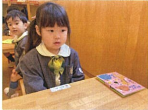
「おたよりばさめを机の角に置いてね」と伝えたと... 角にぴたぴたと合わせて置くことが出来ました♡