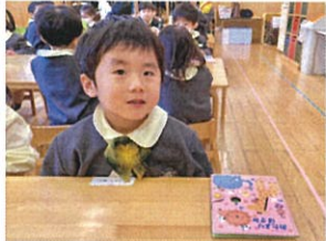
「おたよりばさめの 片付け方を聞いています...」