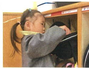
園帽も上手にかけられるかな?!! 真剣な顔♡