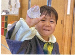
粘土でキョウサの旗を 作っていました♡