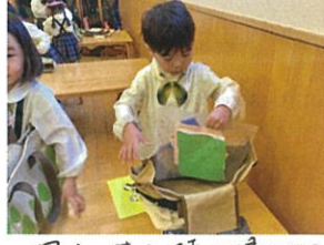
週末です!! 持ち帰り物 たくさんあるけど...全部入った!