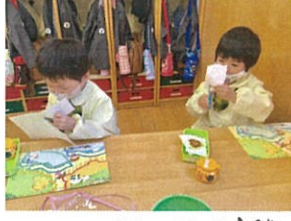
はさみのワーク◎ たのしくやります◎