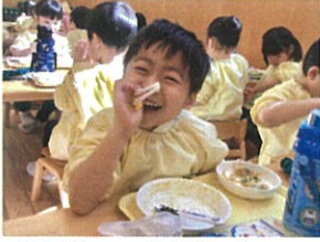
給食の時間は やっぱり楽しいね