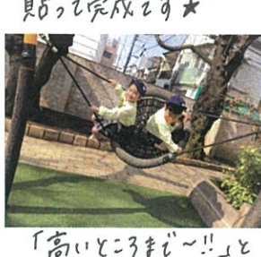
「高いところまで〜!!」と 自分たちで二回しています。