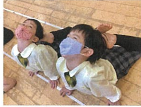
「アザラシ!! とっても 上手です♡」