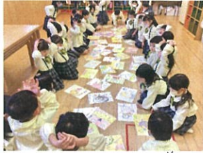
新しいカルタ登場◎ 体の前りのめりにはらないように 手は頭の上です!!