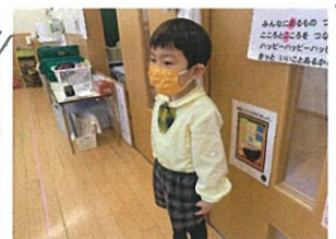
ハキハキと進行を してくれました。