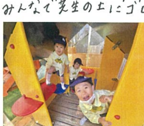
お家にご挨拶してくれ ました♡「いらっしゃーい!!