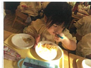
完食までもう少し!! 口を大きく開けてパク!!