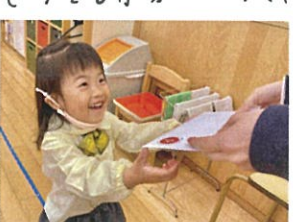
来年度のクラス発表の 良い笑顔をしています♡