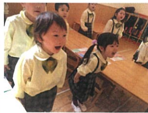
一生懸命音読する姿は とってもカッコよくてステキです。