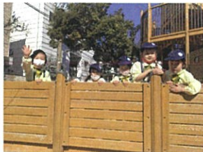
「三〇さん!!」写真を 撮って下さった三〇さんにラブレター お友だちに皆で拍手!素敵です。