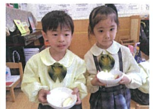
りんごをおかわりできた 2人。良かったか★