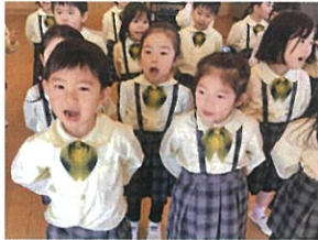
「歌の姿勢。キープ できるかな」