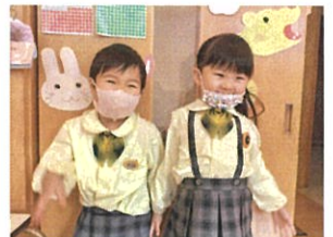
「2/24、2人同時に HAPPY BIRTHDAY!!!」