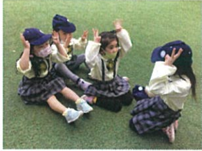
最近、皆で行っている手あてを 子どもたちだけで楽しむ姿が!!