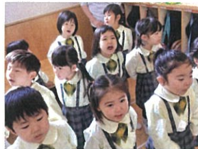
「全てのことに全力で... がんばろうね♡」