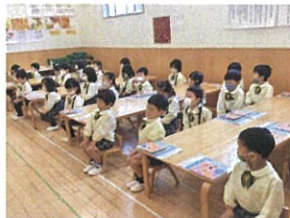
「五月舞の姿勢... キープ頑張ってます!」