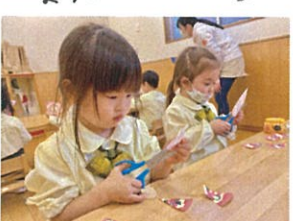
《しきみのワーク》 ヒガを8等分にセカって、