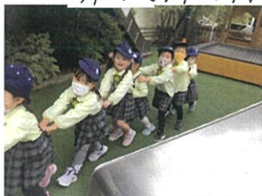
皆で電車ごっこ 気がくさくさ長い列に