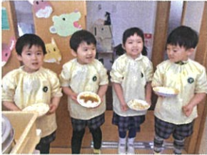
「おかわり行ってきますか カレーの日は人気♡」