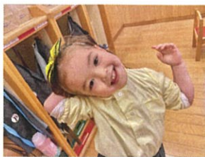
アレ? リボンどこに 行ったの!?