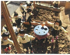
年中にならだつツツハウスの 2Fに登るんだよね