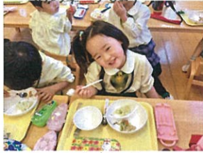
今日も全部 食べられ そうですクク