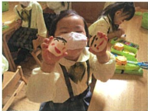
思い出にお写真を描きました。