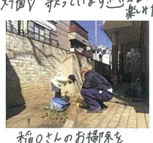
稲の先生のお掃除を 真剣に見る00ちゃん♡