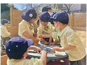
石が場グループが 到来しています♡