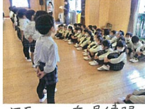
年長クラスの春合唱練習 こまは目の前で見てもらいました!