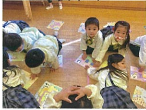
みんなおのきなだとい(笑) 色は戸所がカルタ押えます