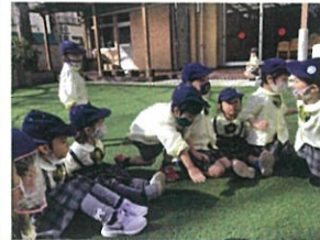
あ〜タッチされよう!と 思いきや、ギョギョセーフなんこは。