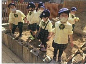
「いらっせいませ〜!!」 お園子屋さん、再びです。