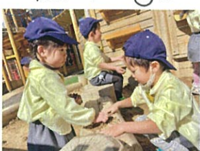
お店屋さんごっこをしたり、