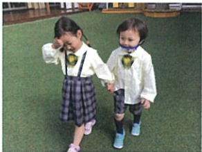
あ日のお庭ではデート!! お友だちを見て嬉しそうに話して