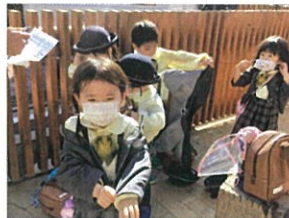
「今日は暑いから... ボロボロ汗っせり♡」