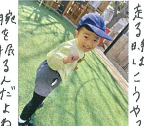
腕を振るんだよね♡ 完璧ですね♪!!