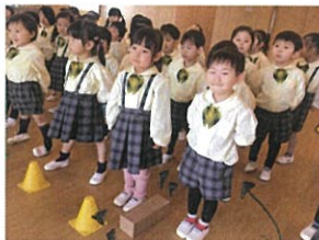
隣の先生がお仕事する ことが決まり、ニヤニヤ 反応が可愛すぎます♡