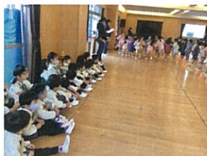
「年中クラスの歌の 上手さにびっくり!」