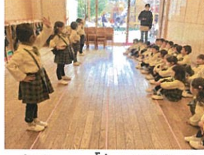
年中さんの「ま、おひなさま」を 見せてもらいましたクク