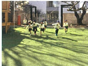
「ダッシュにもハマッて います♡ ♪090↑」