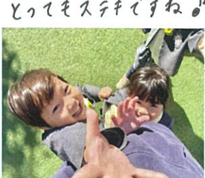
せんせーい! 手を繋ごうよ♡