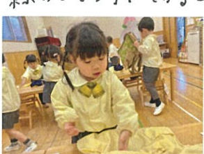
スモックを畳むスピードが UP↑しています♡