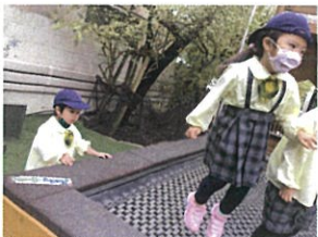
トランポリンも楽しんで お友だちを見て嬉しそうに話して