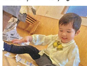
ひさしぶりの折り紙作り 楽しかったね♡