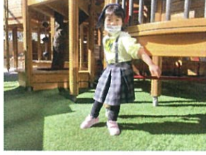
先生 おおかみに見つかって どう逃げようか考える様子