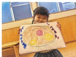
見て♡先生のお褒めを 描いたの!!上手でしょ?