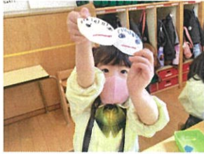
おひなさまとおひなさまの 顔、描けたよクク