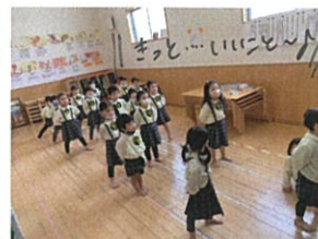
UTABUTAのDVDを見 ながら、イメージ練習!と上手です!!