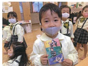
「藤の先生、はいどうぞ!!」 素敵なお手本ありがとう♡