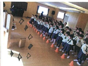
初めての3拍子練習!! 「どろどろのいす」を2対面。