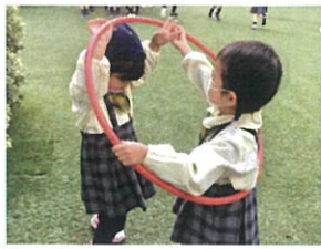
「私も入〜れ〜て!」 「い〜いよ♡」