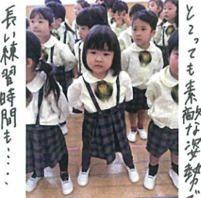
長い練習時間も... とこどもも素直な姿勢で 歌っています。