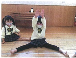
横開脚の準備がステキ だったため、お手をお願いした