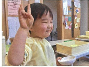
「お野菜も全部 食べたよ♡」