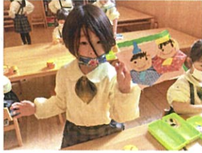
おひなさまがかわいい♡ 向きもバッチリ!!