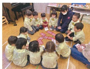
お申せ義理に夢中な メノウクラス😊