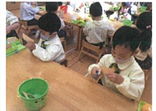
ひなまつり製作の続きです。 画用紙を丸の形に切つて。