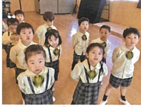
「歌の姿勢、上手に なりました♡↑」