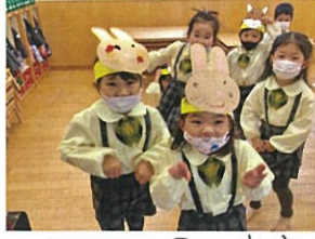
みんなのお面が完成しましたクク つけていざいざ どうぞと云ったらみんな一度は被りました♪