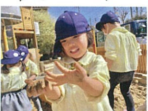
手が汚れちゃったけど、 まっ!! いいよね♡