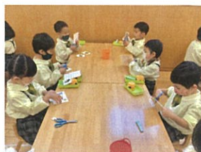
「1はじめの「はさみ」のワーク。 集中しています♡」