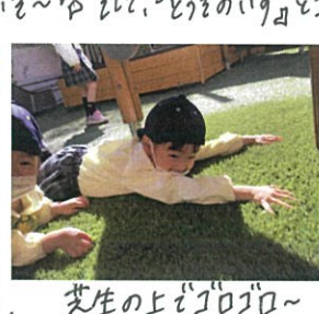
芝生の上でゴロゴロ~ 気持ち良さそうです。