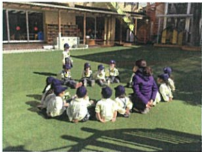
この日も皆でハンカチ落とし ゲームになってきました。