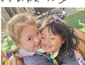
また明日ね♡ さよならのキュー♡♡♡