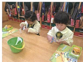
ズレボのハチミツのワーク お上手に出来ました!!