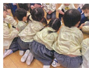
「何が出た!?!」と どんどん前に…(笑)