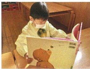
読んでる戸りは見られなく ない様子です(笑)