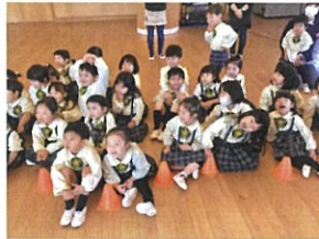
「先生の話に皆 大笑い♡」