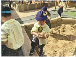
おのきなだといに おのきなだといはあったよ☆