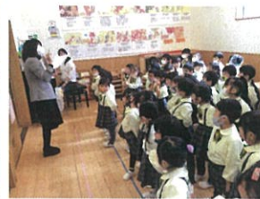
前の先生から「素敵！」 「天才!」を頂きました。