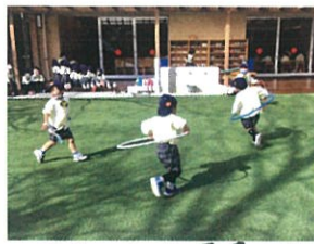
男子たちは電車になって 走り回ってます♡