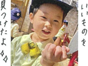
見てきたよ♡ とってもワクワクしてる♡