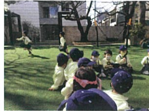
アグアミンさんだけで初めて の「ハンカチ落とし」を開催。