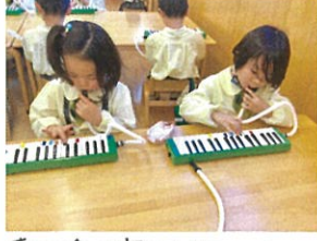
朝の会で毎日ピアノ吹いて います♪ホースは毎日持って 来て下さいね◎