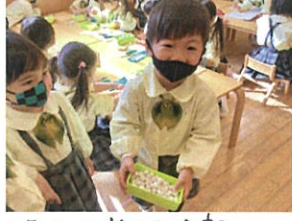
持っている粘土を全部 丸めようです!! すごい 105コ だぞ◎