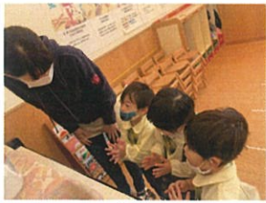
三〇さんがロビーを弾いて 下さいます。相手をお礼を☺