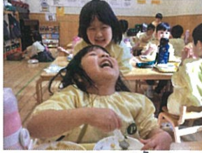
こ〜んなに「笑、ちゅ♡ HAPPY TIMEです♡