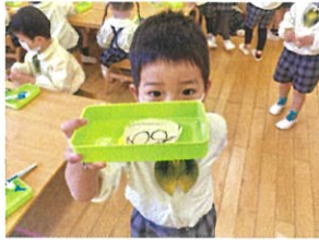
今日はここまで☆☆ 粘土のふたに入ら一度 おあずかりします