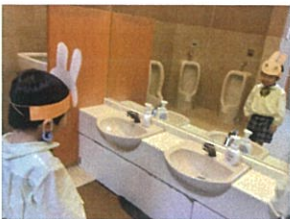
「自分のお面をつけて... 鏡でチェック♡」