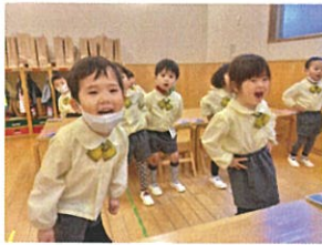
キラキラ星を身ぶりながら、おしりをフリフリ♪ 楽しいね♡