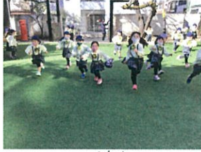
みんな競争!!! 自分か一番なる!!!と本気 です!!