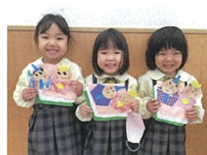
ひなまつり製作が 完成しました!!