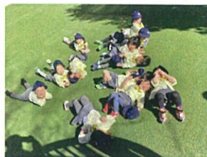
「あったか〜い♡」ホカホカの日の園庭は みんなで先生の土にゴロン。気持ちがいいね♡