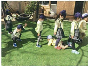
Pearl Nursery Schoolの お友達にトンネルを☆