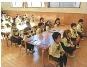
今日から新しい話に入り ました◎姿勢がよくなりましたね!!!