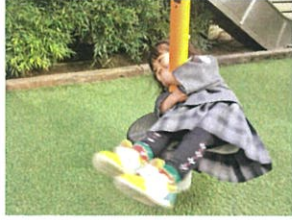
ローリングボール、すごい 乗り方してます(笑)とこも 楽しんで◎