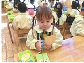
おひなさま製作始まりました!! まずは糸いじりパーツを全部 貼ります!! 真剣です