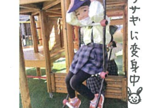
ウサギに変身中◎ ここおひなさまの場所◎