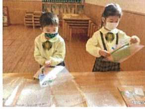
ひなまりの製作、友達か 名前を確認しおひなさまに 入れておきました