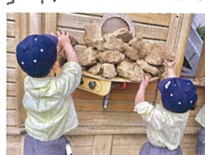
火きき芋を火にかけていたり… ((この日はカレー作り♡)) 想いやりが豊かで毎日とても楽しいです♪