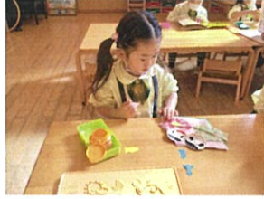
切って、描いたパーツを 全部貼っていきます! 上手に貼ってます♪