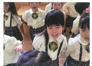
クラスでもとってもいいお友達 がいます。お友達が 集まると