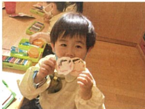
「お肉巻とおひな様。 かわいくお身が揃いました♡」