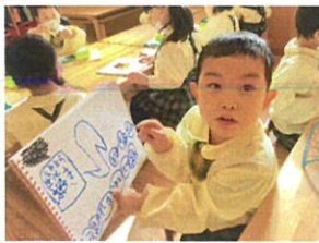
ウルトラマンLOVE♡ 自由画帳はウルトラマンでいっぱい