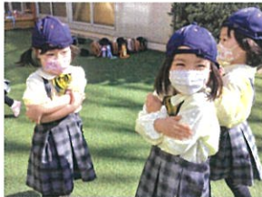
「ウキウキ ♪ おかけな〜い♡ (笑)」