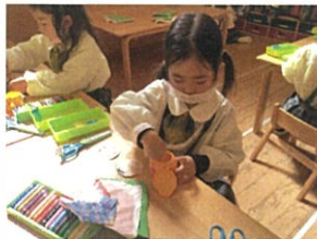
最後は細いパーツをのり 貼って完成です★