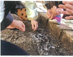
朝、園庭の土の上に 霜柱が!!!