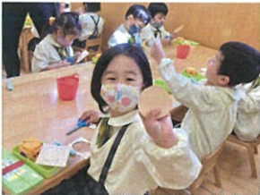
「おひなさまの製作は ハサミ、上手になりました♡」