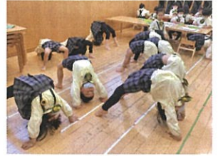
「ブリッジだつてこの通り!!」