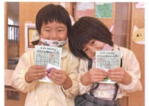
「毎日ゴソゴソ乗車券交換 がんばりました♡」