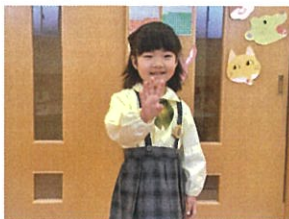
「4キになりました♡ おめでとう!」