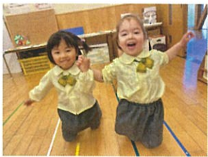
「ヒガおばけ〜!!」と 迎っている2人♡