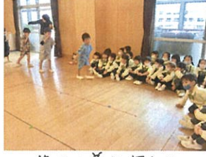
甚平を着た年中さんの 練習を初めて見てもらったに◎