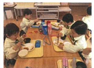
年中さんに向けて「お箸」を 使って食べることを強化中です。