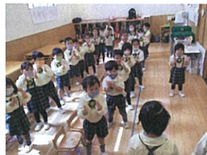
歌の練習でお手本に選ばれた ひなまつり製作が 完成しました!!