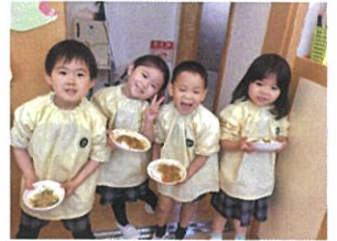
「おかわり行ってきましたか 大きくなあれ♪」