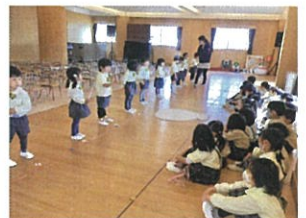
「メロウさんの練習も 見学してきました♡」