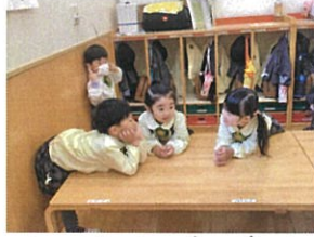
「何やらお喋り中♡ 何を話してるのかな〜?♡」