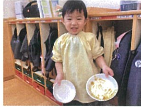
「完食〜♡ ハナマルです♡」