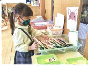
木の土台はどこかな?! かごの中から探して対◎ あるかな?!