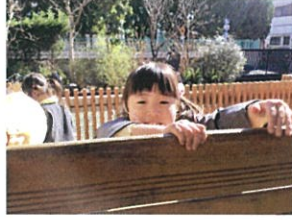
かべの反対側から ひょっこり出てきました◎ かわいい♡♡♡