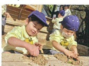
一着にお料理したり、