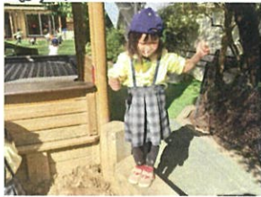
砂場の縁、糸いじり 歩かなくなるとね◎真剣です