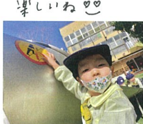
ここは登っちゃいけない 場所なんだよ!!