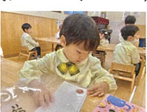
大きな封筒は自分で クリククリの中へ!!