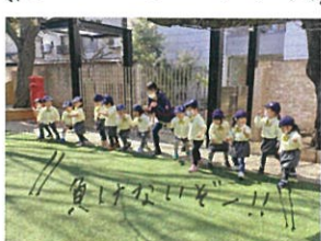
メノウクラス全員で 全カダッシュ♡