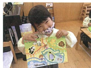
貼るところもバッチリです! 上手にできたか♡