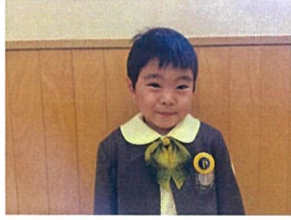
Happy Birth day♡ 4才になりました◎