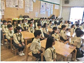
「エメラルドクラスの朝の会。 「カッコーイ♡」