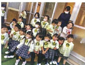
年長さんのウルトラマンの 衣装を着てテラスに来たので みんなクラスから出てもらった(笑)