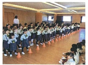
3FでのVIA BUTAIの 練習♪メロウさんがお客さま♡