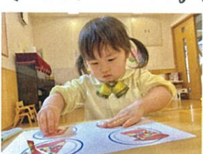
「何枚ずつにしよう?」 お皿の上に分けました!