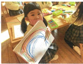
「にじ」描けたよクク スライ挿してる、 上手ですね☆