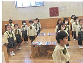
「音読も張り切って ますよ〜♡」