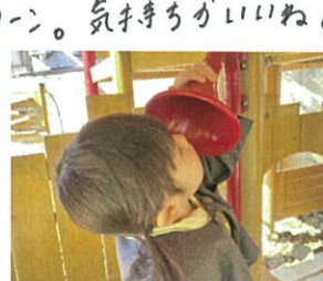
もしもーし!! 明日はまたですかー?