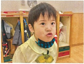
大きな口で身ぶり姿… とってもステキですね♪