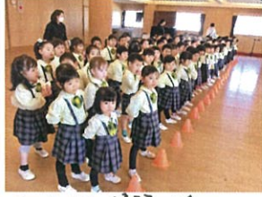
初☆3F 練習クク 午後にはおひなさまでした♪