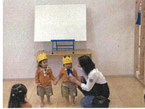
お名前も好きな食べ物も上手に言えました。 ずっと二人で手を繋いでいて、可愛いですね♡