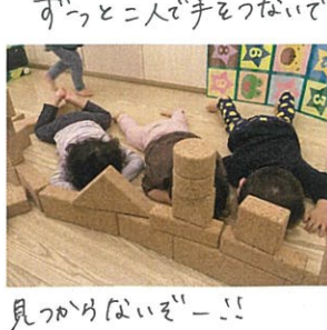
見つからないぞー!!