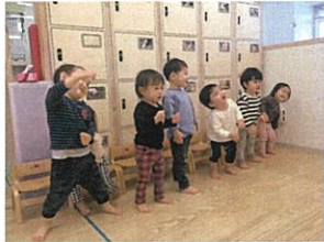
元気いっぱい レクルクラス☆