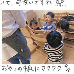
おやつの手紙にワクワク ♪