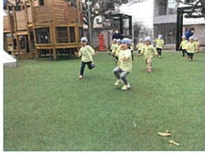
「だるまさんが転んだ」も だいじょうぶ上達しました♡ その次はいろんなポーズで 「待っていること」... 「待つ時は「バナナポーズ」!! というお約束、上手に守れたね。