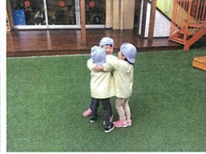
日手には、キコー!!としりぎて、ステッカー お友だちが「大丈夫~?!」と助けてくれる優しい♡