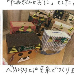
ベリルクラスも糸でつくりました。