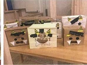
おにのペンツを かわいい♡