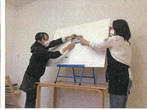
先生たちからのプレゼントは、 「ためぎんおに」でした。