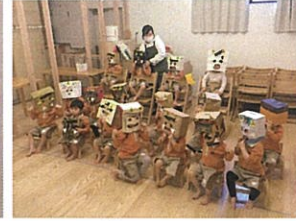
みんなが被ってみました♡