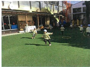
時には園庭をひとりじめ♡の びのびと遊べます♡