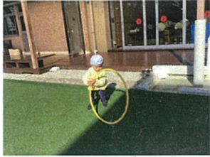
フラフープを転がしてリ。 遊び方は色々々々