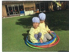
お友だちと話し合せて、 お家ごっこをしてリ...