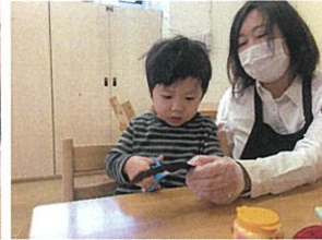
レクルクラスの長髪の毛は 画用紙で! 上手に切って見られました♡