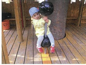
何かに乗るのも大好き々々 ツリーハウスや、ローリングボール に乗っている姿... まるでお入浴さん♡かわいいです♡