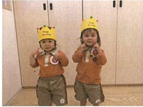
Happy Birthday ♪