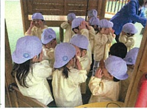
先生を探せ色々かぐれんぽも上手に 教えることを通じて、数字を覚えていっています。