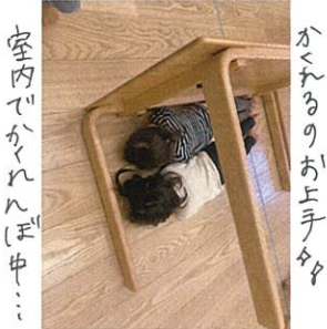
室内でかぐれんぽ中... かぐれんぽのお上手々々