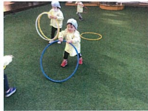
フラフープの遊び方も様々な フラフープのお散歩(?)をしてリ...