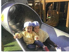
お友だちとひなたぼっこ♡ 仲良くコンビです♡