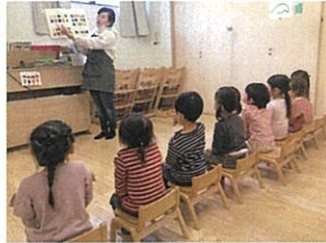
しっかりとお話を聞くのも 上手なベリルクラス☆