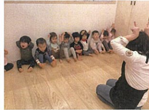
おにのペンツはいいペンツ 強いぞ~ ♪ ぴん