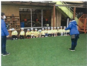
園庭遊びの前には お約束を聞きます。