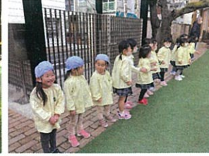
サンゴグラスにまぎらて ダンスの練習は