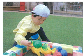
「緑は緑でも、どの緑が 良いかな?」と見比べています。