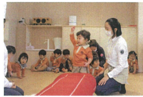
「ハイ!」と素敵なお返事もできます。