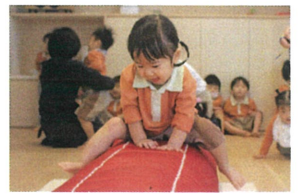
1歳児クラスのお友だちも ゆ〜くりと上手に進めます。