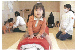
カメラ目線をしてくれました。 ちよとさう前〜前〜前!