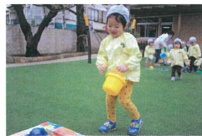
「どれにしようかなあ...」 と喜ぶながらも困っています(笑)