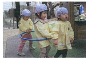
みんなが、フーフーフ 電車を手でうなげます👩🏻👧👦