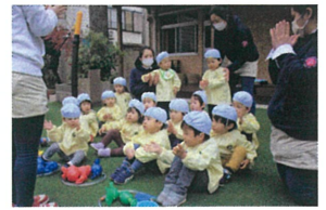
1番早かたチームに みんなが拍手〜👩🏻👧👦