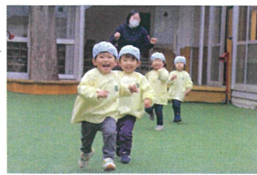
「負けなぞん!!」 という気持ちで伝わります。