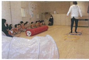
先生のお手本を か〜いいお山あわりで 見せてくれます★