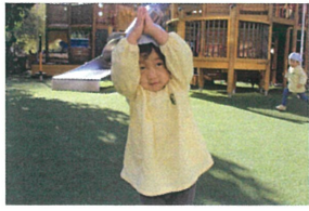
「バナナ〜ナッ🎵」 可愛いバナナに変身🎵