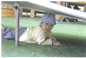
「み〜つけた★」 すべり台の下も通れるよ!