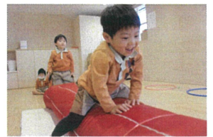
スイスイと進められる チカラが付いています。