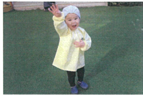
バナナ鬼の最中に... 「痛い痛い」とんてけ〜👹