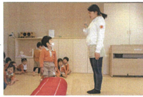
幼稚園のお兄さん お姉さんのように 「気をつけ!」