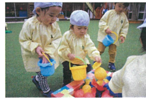
みんながバケツに 好きな色のキャンディーを 入れています👩🏻👧👦