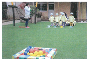
《お買い物競争》👩🏻👧👦 「うわあ〜とくちを大きくあけていて バケツにキャンディーを入れます。なんでも嬉し〜👩🏻👧👦」