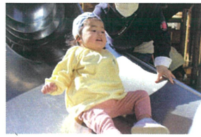
「わあ〜?」とちびり みんなよりしまけ(笑)