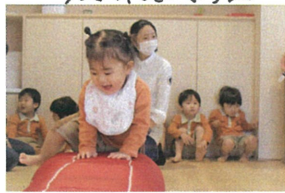
やると順番が来て やる前からこの笑顔👩🏻