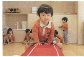
両手をついて、腕の力を 使って、進めます。