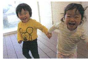
お着替えが早かた お友だち👩🏻👧👦