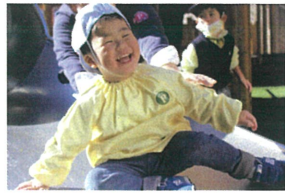
先生に背中を押して もらって、すべり台を挑戦中👉