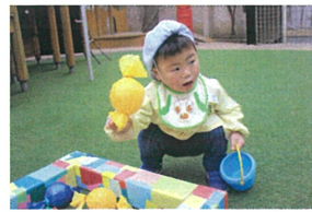
「黄色はコレ?」と 先生に確認中