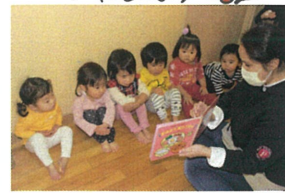
身体測定の順番待ち。 ステキに待てるようになっています👩🏻👧👦