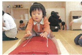
両手をポンッと ついて、進めよう!~になっています。