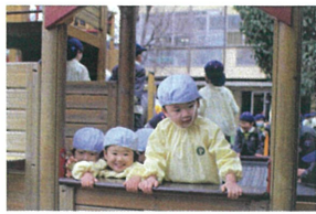
「やほ〜ケケ」 先生を見つけてニコニコ😊