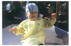
思っていたよりも スピードが出てビックリ👀