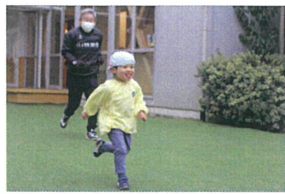
藤井さんとみんなが ダンス対決💦