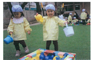
「黄色見つけた〜★」 とステキな笑顔👩🏻👧👦