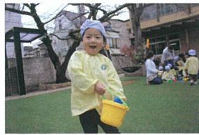
このキャンディーにある 鼻の下がのびてる!?