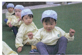
「エイエイエイ〜👩🏻👧👦」 両手をグーに喜びます👩🏻👧👦