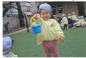
「ジャン★」とキャンディー を入れたバケツを見せられました。