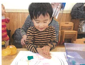
1・2・3・ハッ☆ トッピングもつけるよ!