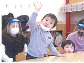
「ハッ!」立って お遊戯できますよ!