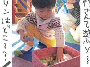
ママとリンクコーデ♡