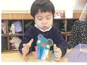
カエルさんが 立ったよ～😊