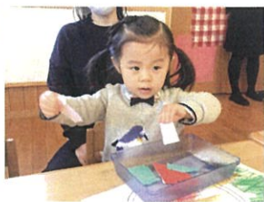
折り紙をびりびり ちぎりますよ～!!