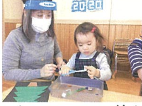
初めてのハサミ☆ 慎重にチョキチョキしています☆ Good!!