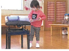
使ったもののお片づけ、 自分でできるんだよね!