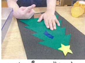
のりの量はどれくらい たのびかな??