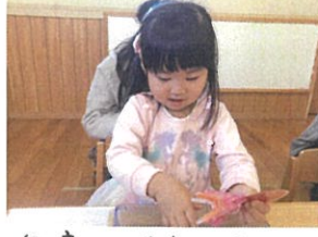
知育あそびで、ハサミの ウォーミングアップ☆