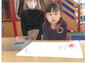
「手はおひざ」が とってもステキです!