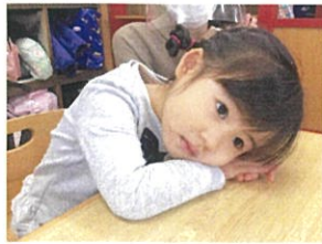
おねむりポーズが So Cute♡