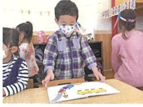
なんかおもしろそうな 糸本あったよ😊