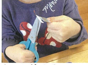
初ハサミ頑張りました!!