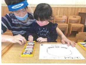
ニセんのワーク☆ (何色にしようかなあじ?? ぐるぐる描いてミックスジュースを完成させよう!)