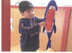
カ——ワッ!! サ×さんお気に入り♡