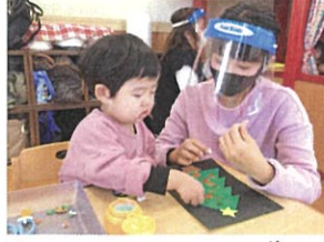
キラキラ折り紙で クリスマスツリーを飾りかた