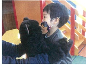
くまさんとギョウ☆ キリンはどこ??