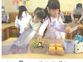
よく見ながら同じ作業 お片づけも完璧です!!