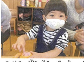
のりをぐるぐる混ぜている お友だちを見(笑)