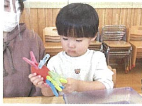
洗濯バサミで知育☆ 真実な表情です!!