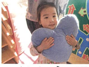
ハートワッショ☆ Part. 2♡ ふわふわで気持ちいいね!