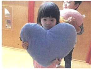
女の子に人気の ハートワッショ☆