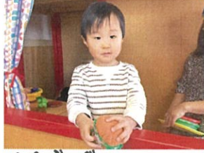
ハンバーガー 【おいどーぞ♡】