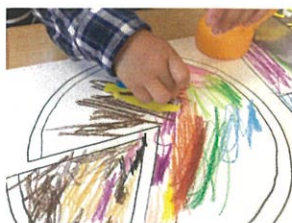
ああ! おいしそうな ピザにたのびたね!