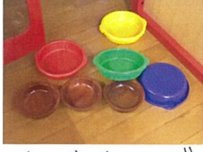
お皿がゼン～んぶ 床に出ていました(笑)