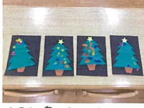
個性豊かなクリスマス ツリーの完成☆