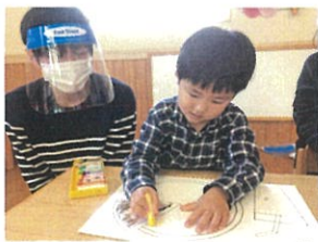
好きな色のクレヨンで はぐり描き～😊