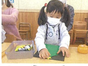
ツリー祭のツリーには お星様を貼りました☆