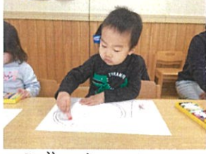
ピザと言ったら 赤いトマトソースだね!