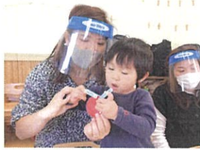
洗濯バサミを開くと おうちもつられて…♡