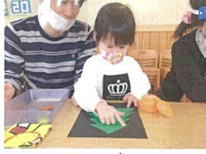
クリスマスツリーを のりづけしていくよ!