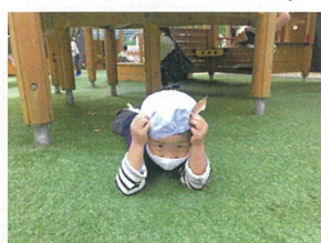
葉っぱどうぶつの耳を作ったよ!! ♪