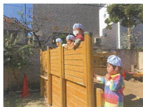
なんだか黄昏れているパールクラスさん♡