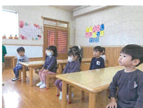
“腰骨を立ててください”を練習してみました♡