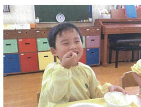
楽しいLunch time♡ 自然と笑顔にほかわ♡