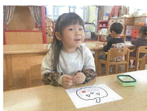
ハロウィンシールあそび♡ ハロハロパーティしたい♡ ...だよ♡