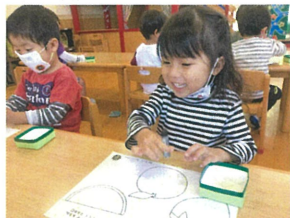
初回は“てんてん”を描いて、菓物を完成させました。😊“おいしくあれ♡”と口ずさみながら♡