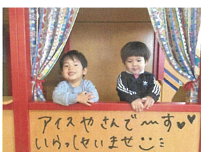
／かかせんはいお客さんね! いちごアイスください♡