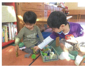
動物園を（作っているんだね）