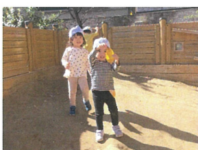
大きい葉っぱ見つけたよ! ママにプレゼントするの♡