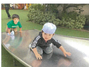
お兄さんになったら、スライダー滑ろうね♡