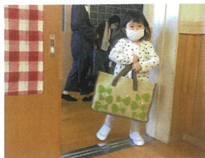
／おはようございます！笑顔で登園してくれます♡