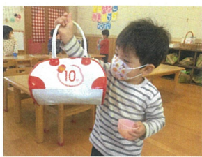
このバッグを持って、お出掛けするんだね！