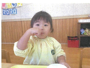
前髪Cutは=000ちゃん♡ 1人合っていますよ♡