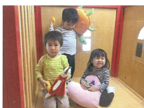
それぞれお気に入りのおもちゃを持ってゴキゲン♡