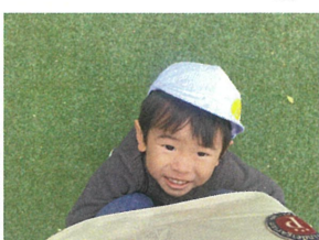
／先生♡ すごい♡♡♡ 可愛い♡♡♡