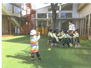
年少クラスのかおかごめが、気になる様子♡