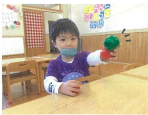
青りんご🍏が1番美味しいそうです♡