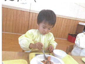
／これお魚～?? ♪ ぞうじよ 沢山食べようね!