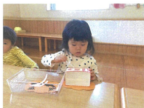
廃材を使った製作の仕上げです。両面テープを剥がして、カボチャを見るよ～!! 1・2・3・パッ♡