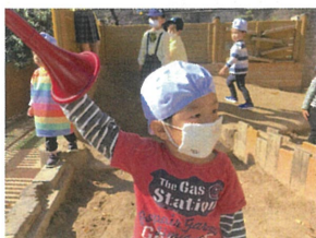
もしもしフェーン、どこに繋がっているのかなあ♡?