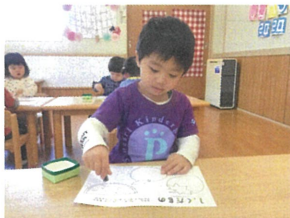
初めて、“線のワーク”を行いました♡