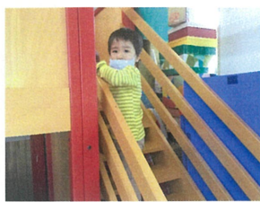
（よく2階に行くと、先生も行く～ん?）