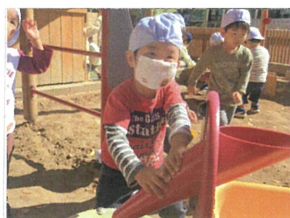
砂場にもおもしろい遊具がたくさんあるね!!