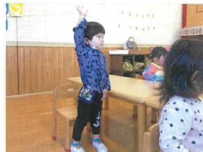
“名を名乗る”・・・が、とても上手にできています。先生と目を合わせて言えるお友だちも増えて♡