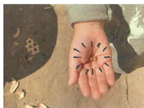
なみと!“どんぐりの赤ちゃん”が園庭に落ちていました♡