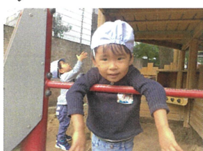
カマエを向けたら...ポーズしてくれました♡