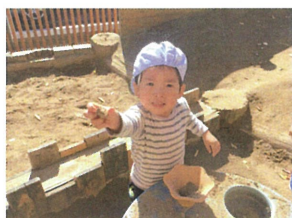
2人とも、/見て見て! ボールだよ♡...と教えてくれました!! 小さいボールと大きいボールだね♡