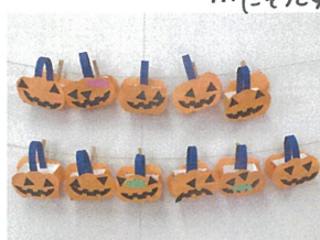
ハロウィンBagにお菓子をたくさん入れられたかな♡??