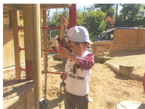
フェーンを引っ張ると??? 2階に砂が運ばちゃう♡