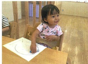
魚にワレモンで色付け。 筆もバッチリでした♡