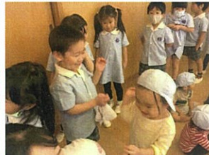
雨でしたので、幼稚園の3階ホールで年中クラスのパラバルーンを見学。そしてなんと 爺カゴまでいかにできました♡ドキドキワクワクした貴重な経験になりました♡