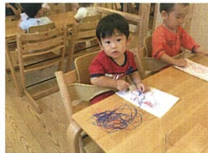
あれ?!あれ?!(笑) 広いキャンパスですね。(笑)