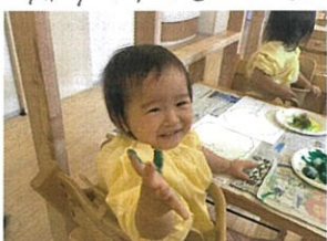
10月から新しいお友だちが増え♡どうぞよろしくね♡可愛♡