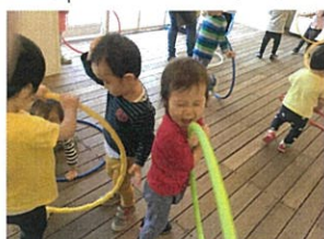
このクラスは私の!!と独り占め♡ 来週はFESTA多國那♡いね。