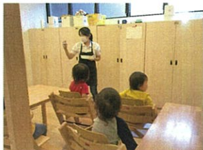
秋雨が続く日は...ワレモンあそびやえのぐあそびや ルルルクラスも先生のお話を聞く習慣をつけていきます☆