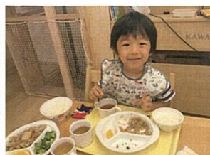
全部おかわり♡可憐! 全部おかわり♡可憐!