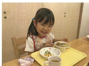
最近のバブルクラスは、食事中もお話が大好き♡ 楽しみながら、お友だちや先生と会話を楽しんでいます。