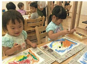
バブルクラスさんは、カラフルで 個性が光るお魚になりました。広いキャンパスですね。(笑)