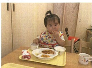
お食事シリーズ♪時には手で食べちゃうことありますが、 フォークスプーンを上手に使う練習中のルルルクラスです。