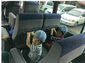
この日は初めてプライマリーの バスに乗りました♡大興奮!