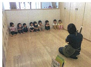
お山座りもとても上手。 FESTAもできるかな?