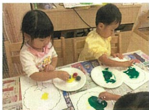
スポンジ等の道具を使つてえのぐあそび。バブルクラスさんは、ポンポンポン... と色付けをするより、豪快に滑り方が気に入った様子。ワイルドな作品となりました。