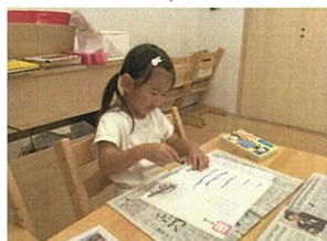
センのワークにも挑戦☆先生のお話をよく聞いて、 「何色で塗る?」「線はまっすぐ?」考えながらできました。