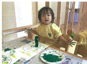
こんな遊び方も♡多 スポンジを積んでました♡