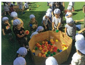
FESTAの練習も何度も繰り返していくうちに、楽しい！ できる！にわかってきた子どもたち。本番が楽しみです☆