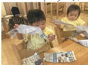
一方こちらでは... 新聞紙あそびになってる!!