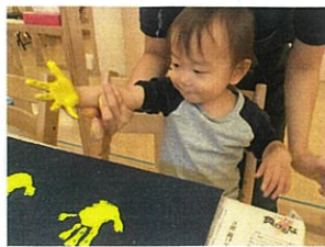
これもFESTAの準備♡手形をとって星☆に見立てて、玉入れのカゴ(入れもの)を 作りました。どんなカゴになったか...来週のindexを要チェックですよ♡