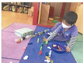
「泣帯!泣帯!」だそうさ。 動物園かと思った♡