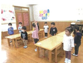
10月号の園だまりでご和歌の 「気取上げ」の練習中♡ とてもかこい♡