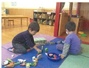
2人で黙々と「何かを」 作っています...♡