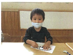
「ここに貼るのはブー×！」 ・・・と先生の真似をしています♡