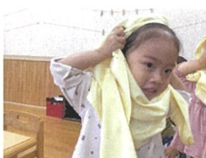
ニスマックの着脱頑張ってますシリーズ☆ お顔がひよこ♡