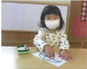
あ、お月達を、に、 大々夫！そんなときもあるよ♡