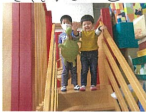
「2人でかみ挿まるとよ!!」 か...か...さんの首が...♡