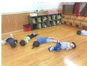
リトミックでのコマ。 お馬川深井の寝るポーズ♡