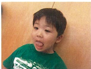
i Padのイマクラジ ハイチーズ☆