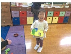
とびきりなSmile♡の ウエイトレスさんです☆