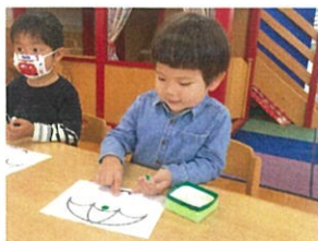
「今日のミールあそびはなあに？」・・・と毎回 楽しみにしてくれています♡木曜日は☔でけに