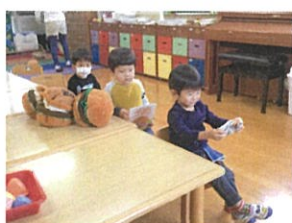
バスだ〜〜と... 即席ハンカチを作りましたが! とても小さかった♡ごめんね(笑)