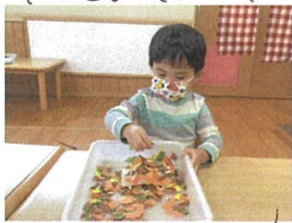
「みのおし」製作中 完成が楽しみ♡