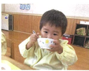
お茶碗を持って たくさん食べるよ♡