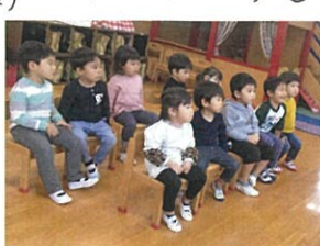
今日も「みんなうち」に夢中! また来週も言葉もうね♡