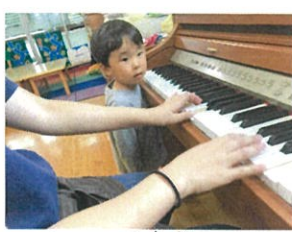
ピアノの鍵盤に 興味津々♪