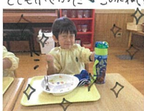
お給食初々完食♡ ごめいスタンプGET♡