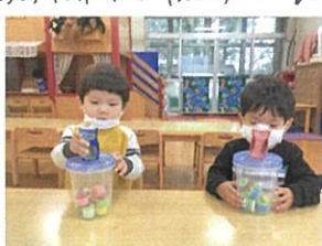
ポットとジュースを合体!! 片側の席のお友だちと 同じ遊びをしていました♡