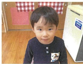
キラキラな瞳に... 吸い込まれそう♡