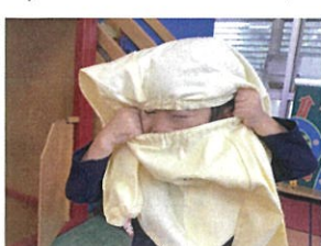
はかばか顔が出てきて、 OOO人大笑♡