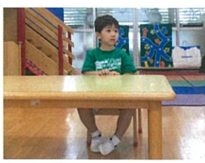
先生に目からキラキラビームを送 送、てくれています♡