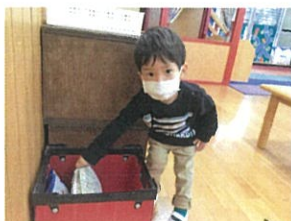
おもちゃは 赤いBOXに入れます！