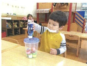
ポットとジュースの コラボレーション♡