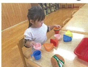
ど木にしようかなあ... 迷っちゃ〜♡