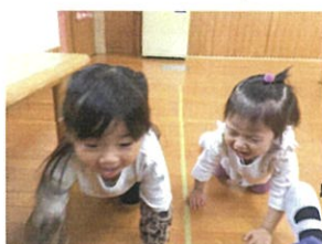
突然「ハイハイ」 追いかけてました(笑)