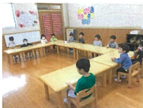
机の周りに置いた字の してみました！新魚羊