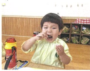
あ〜ん♡のお頼♡ お茶美味いよね！！