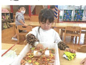
ビリビリした画用紙と トイレットペーパーの芯で...?!