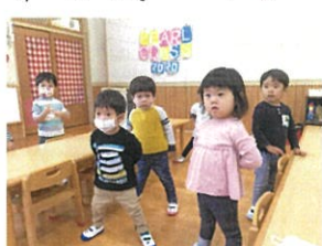
こちらは「歌の姿勢」 できる時に「あてき」ね♡