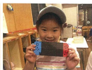
折り紙でニテンオーステイック作り♡