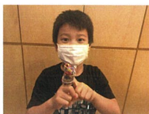
指が大きいお友だち!!お茶目可愛すぎます♡