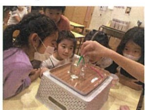
サイエンスでは...ストロー(本)で水が移動する不思議を説明!!