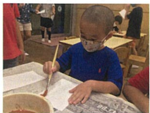
その上から糸の具で色をつけると... →