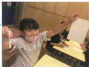
ろうそくを使って絵を描きます! (可も描いていないように見えますが...)