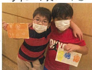
完成しました♡ 仲良しSHOT ♪