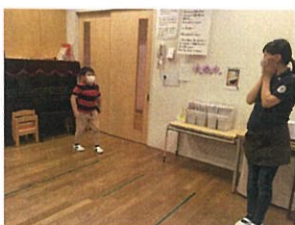
1本1本の時どうすればいいのか...シミュレーション中!!