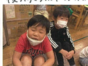
九九のうたにも歌い始めました! 目を7つとも歌えます♡