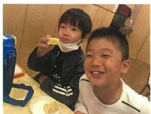
そして...新メニューのさつま芋もちです♡