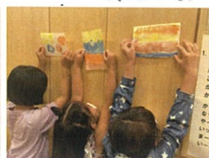
あえてよ!! さいと後ろ向きSHOT?! (笑)