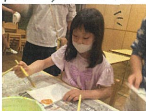
ろうそくで描いてから"浮かび上が"てきます!!