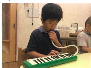
ピアノの音も動きも始まりは音楽♡