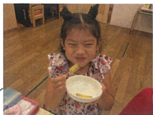
あやのTime♡本日のメニューはおやつステイック♪