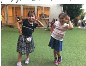
①今話題の"NioiU"のダンスを見せてくれました! フルサイズで完成度も高く... 驚きまは♡