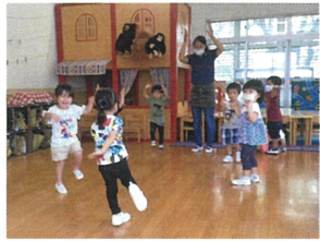
リトミックをしました! 音楽 吉●先生も楽しそうでした♡