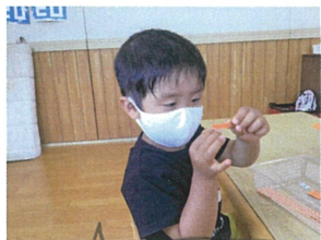
見て! こんなに小さく ちぎれたんだよ😊