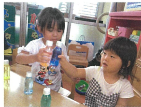
ワキワキ ガヤガヤ 秋ジュースとサイダーで かんぱい♡