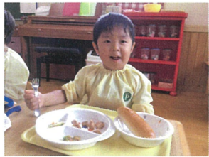
おいしくおいしく BBQソース味でした♡