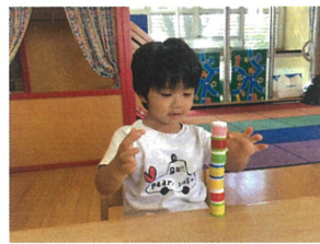
遊び方は無限大!! 子どもの発想が勉強になるぞ