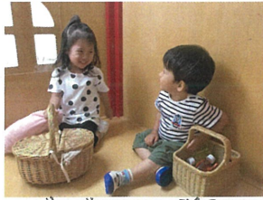
ラブラブな2人を発見♡ 「なに写真撮ってるの〜」 ...と言われたら笑