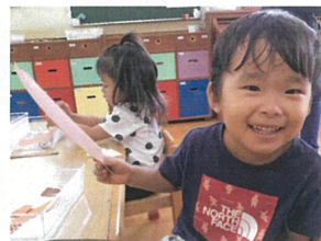
しまくもビリビリできるよ!! 見ていてね♡