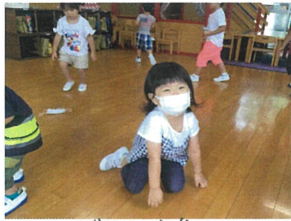
ピアノの低い音は 「座る」というルール😊