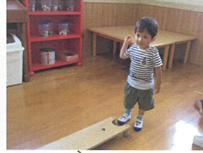
お名前を言ってからStartス