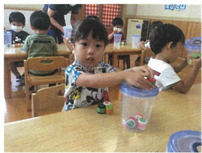
今週は、ニールあそびの時間に「知育あそび」をしてみました😊木曜日は、 ポットン落としに挑戦! ペットボトルキャップとコト型があります。集中力アップ