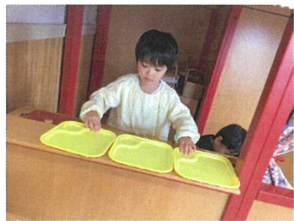
トレーを沢山並べて、 ご飯の支度中かな?!