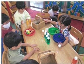
さあ! これから Partyをするよ