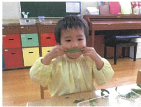
給食後、画用紙のハサミで遊んでみました! ☆「おみげだよ」 「おうちだよ」 「みかん味ののりまきだよ」などなど想像力が豊かです♡またやろう