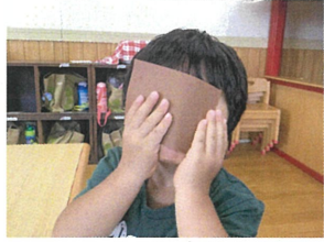
さて問題は... しまくは言葉でどう???