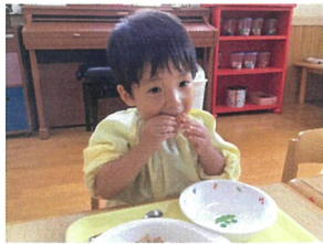
大きなおうちで パクリ♡