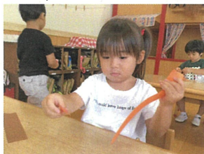
金曜日の知育あそびは「糸をビリビリ」でした! 音 実は...今後の製作の材料でもあります♡お楽しみに♡