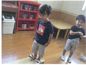
ゆくり... 小夏重に げんごかなあ♡