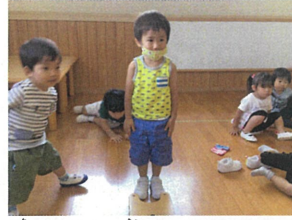
「気をつけ」とても ステキな足が揃っています!