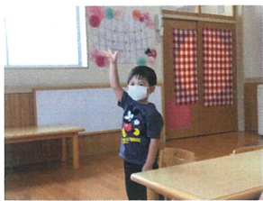
キラキラの眼差しで お返事してくれました!!