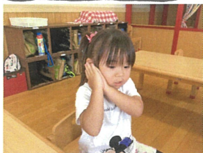
おねむりしたあから... キラキラ星を歌っています