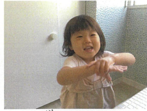
トイレが済んだら、 手をペロペロにしよう