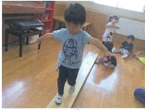
飛行機がフ〜ンと バランスをとって進むよ!!