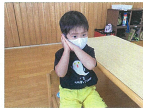
おやすみなさ♡い☆ 心を落ち着かせて、朝の会Start!