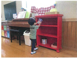
お片付けは、名前を 呼ばれた人から順番に...