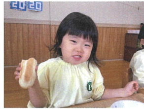
給食シリーズ☆初めてのパンに挑戦したこの日。 パンが好きなお友だりがたくさんあるという間にペロリと