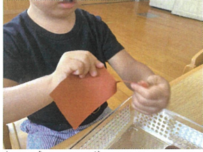
「手を返す」この動きが なかなか難しいのです