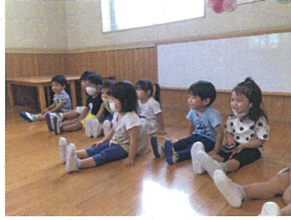
1本杖あそびが始まるよ♪ 心ざを伸ばして、曲げて...