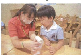
9月2日(月)の敬老の日のプレゼントを製作しました。先生と一緒に気持ちを込めて作りました。