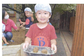
「はい! ビンぞう」ステキなご飯をくれました。