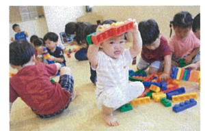
お部屋にたくさんの「ブロック」を出してあそびました。