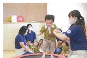
1歳児クラスのお友だちもジャンプがとっても上手♪