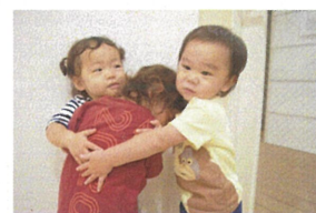
お友だちが大好き♡ ギャーとしてみました😊