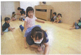
ヘビさんに変身して先生の上で、おとと。(バランスを取っています)