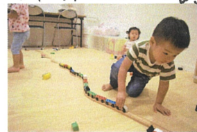
線路をなが〜く繋げてみました♪