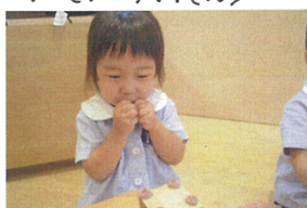
今回は「リンゴ」を選んで...パクッ♪