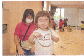
お昼寝ごっこ「お布団」ごっこ!