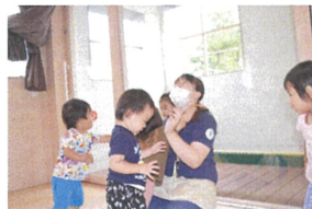
最後のゴールにいる先生にも♡