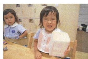
「めでめで! 貼れたよ!」