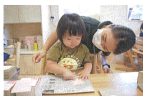
人差し指を使って、のりを「ぬりぬり〜」上手♪