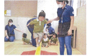
平均台も、上手に渡れるようになりました♪