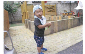
園庭で「お砂場あそび」をしました* スプーンやカップを使ってママの料理のマネっ子♪