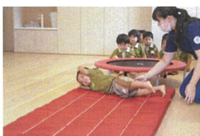
両手を上に伸ばして「コロコロ〜」