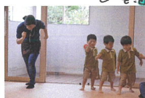
「いちにいついよーい」のポーズが、とってもステキ♪