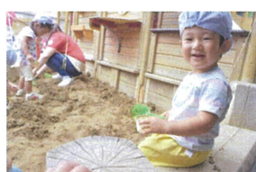
先生とまったりお茶タイム