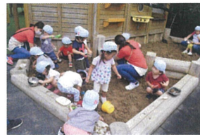
園庭で「お砂場あそび」をしました* スプーンやカップを使ってママの料理のマネっ子♪