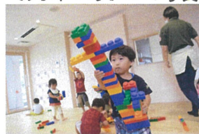
「倒れないで〜」と気持ちを込めて真剣です。