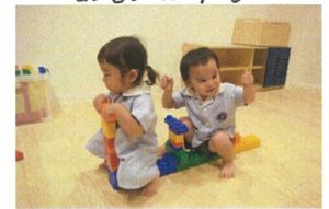
先生に作ってもらったよ☆ 2人とも「リリリ」です♪