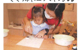
スタンプでメッセージを