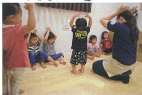
お帰りの会が終わったら先生と手あそび♪これから何が始まるかな?