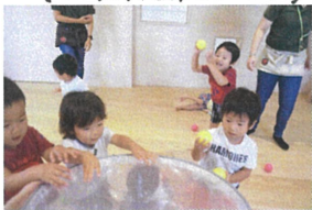
実はコレ... いつも使っているトンネルを縦にしました!