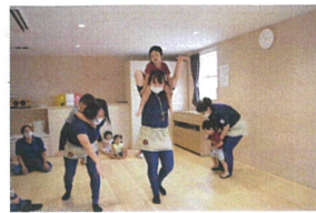
左からゾウ・キリン・カニ 誰がいちばん速いかな?