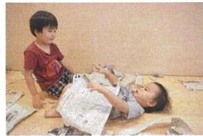
Pearl Nursery Schoolの3階で「新聞紙あそび」を行いました。カワイいうさぎさん〜エサをあげてみました♡