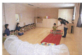
Pearl Nursery Schoolの3階で「ミニミニサキット」を行いました。カッコ良〜お山ずわりで☆ お手本も見てください☆