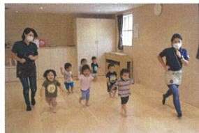
1歳児クラスのお友だちもダンスがとっても大好き♡