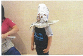
これは...「3日の...」にぞっくり!?(笑)