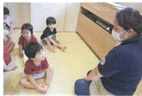
久しぶりに「ふれあひあそび」を行いました。お友だちと先生と変身する動物と一緒に決めました。