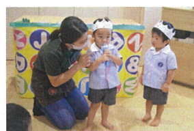
「お誕生会」自分でマイクを持って答えました。