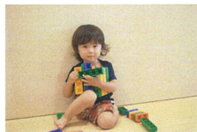
「これは、ボクが作ったの!」大切に守る姿がカワイイです。