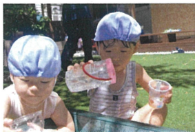
「キラキラして キレイだね」