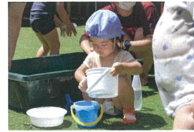
「バケツにお水を汲んで 移し替えてリ 流してこい...」