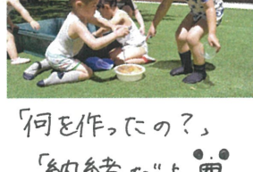
「バケツいっぱいでも 余裕だよ(へー)」