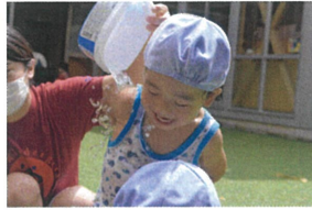
「キャー先生 冷たいよ~」