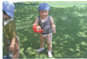
「ソウのじょうろで 誰にかけようかな?」