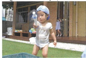
水鉄砲で パシマパシマ