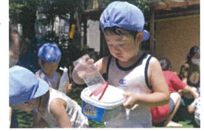
「やっぱり大きい方に しようかな」