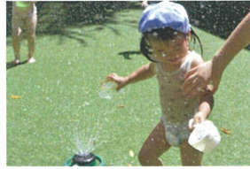
「噴水に近づいて... 「冷たいよ」