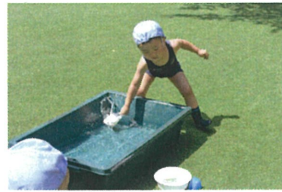
「みんなにもお水を かけちゃうぞ~」