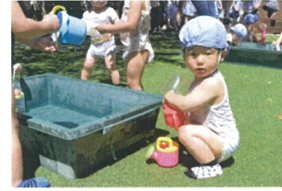
「どれにしようかな? 迷っちゃうな~」