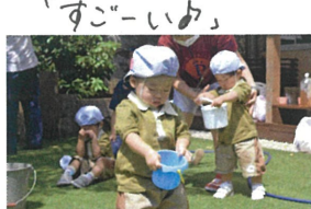
「そーと ゆっくりだよ」