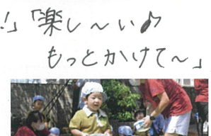
《お水運び》 バケツからお水を汲んで 反対側まで運びました。