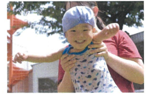
「楽し~い♪ もっとかけて~」