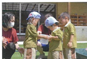
「そーと ゆっくりだよ」