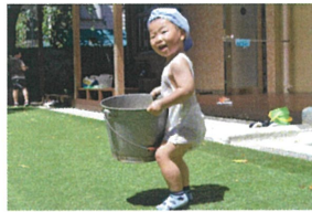
「僕も先生のお手伝い、 さすがか持ち~」