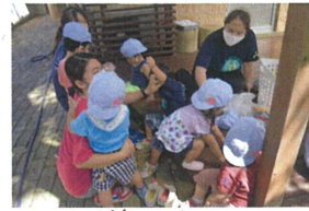
《水遊び》 好きな玩具を使って先生やお友だちと 掛け合いをしながら遊べます。