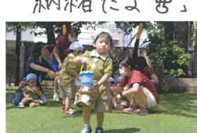
「セミをつかまえたよ~」 セミ探しがマイブーム☆