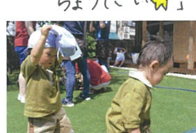
「隙間から... 先生見つけた☆」