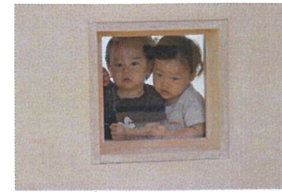
《午睡明けのソマ》 キューッと小窓から 熱い視線が...♡