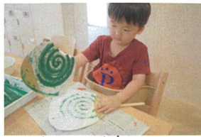
《うちわ製作》 「上手にできにかな?」