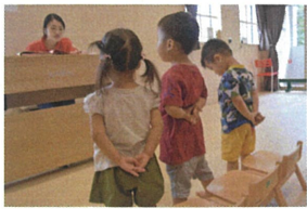
《歌の姿勢》 後ろで手を組んで 足と肩幅に... ステキ☆