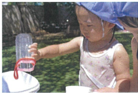
「先生にもお水 分けてあげようね」