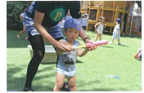
「これはどうやって使うの? 先生と一緒に...」