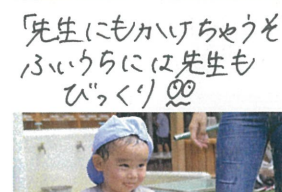
「ねらっちゃうぞ~☆ ペロッと舌を出して 可愛い♡」