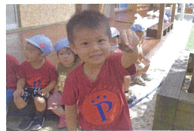
「セミをつかまえたよ~」 セミ探しがマイブーム☆