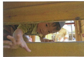
「隙間から... 先生見つけた☆」