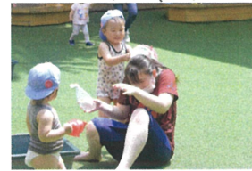
「先生にもかけちゃうぞ~!」 ふいうらには先生も びっくり