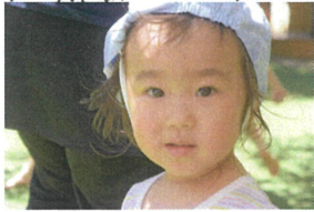
「顔がこんなに ひしょひしょだよ」