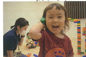
「もし、もし マ、マ、で、す、か？」