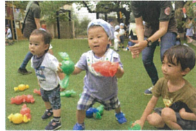
「僕は2個にしてもいい？」