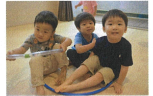
1、つのフ、ラ、フ、ー、フ、に 仲、良、し、3、人、組、ゆ