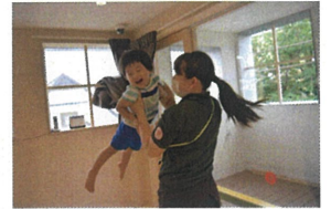
メ、リーゴ、ランド 「目、が回、るよー」