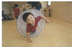
《トンネル》 4月当初からずと行、てきているトンネルで初、最初はくぐる事が できな、たお友だちもだんだんとく、れるようになって来、ました☆