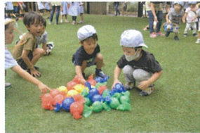
「何色のキャンディにしようかな？」