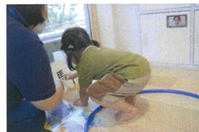
《動物なりき、りご、こ》 言葉あそ、びの漢、字カードを 使、て動物に、変、身、し、ます。