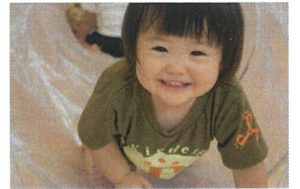
あともう少し... 「先生見えた！」