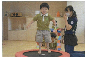
《トランポリン》 2歳児クラス10回、1歳児クラス5回 みんなで教、えながら跳、びました。