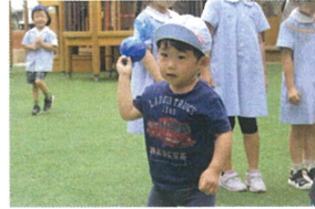
「よーレ いっくぞー」