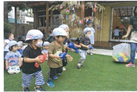
《くもく》パクン》 パールくんとパール子ちゃんのお口に キャンディを入れる遊びです。