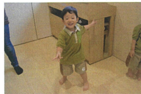
「ぐる、とまわして カーニ、ーさん」