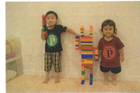
ブ、ロ、ック、で、大、き、な ロ、ボ、ット、を、作、り、ま、し、た。