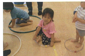
私、はキラ、キラ、の 小、さいフ、ラ、フ、ー、フ、が、お、気、に、入、り