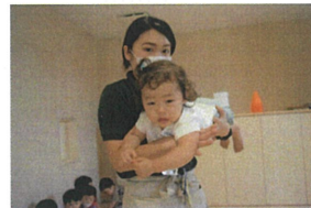
《先生とふれあ、いあそ、び》 先生に抱、こしてもら、い飛行機、や メ、リーゴ、ランドを、してもら、いました。