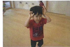
可愛、いうさ、ぎさん ぴ、ん、ぴ、ん