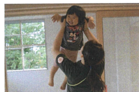
高い高、い、いで ニコニコ笑、顔