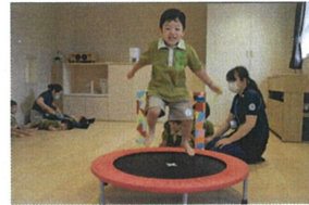
こんなに高く 跳、べるよー