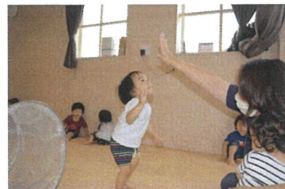
「先生 ちょっと 高いよ～」