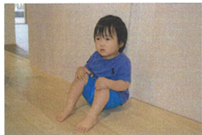
お話を聞く時やお部屋に入、る時にはお壁ポットンでお山座りをします。1歳児クラスのお友だちもがんばっていますロ