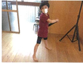
汗だくで楽しいプライマリー-ン