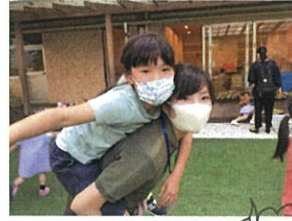
長い先生♡とcute!! 甘える方は000ちゃん