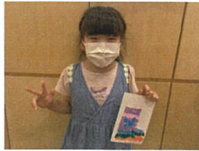
こちらは長靴!! よく見ると、真ん中に猫の柄が