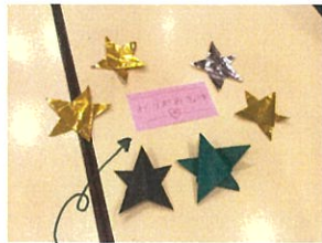
"おりがみまよう室" 陽明館! 今回は星を折りました!!