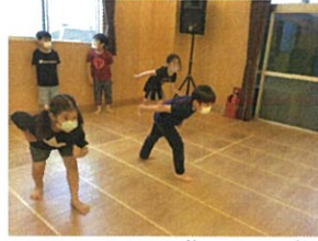
先生にも... 全カです!!