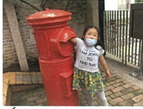
(モ)はこれ以上入らないよ!! 月一杯に腕を伸ばしています