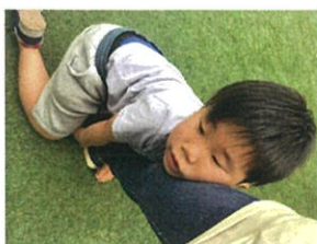
先生の足で-1不み?! 笑 歩かせよう