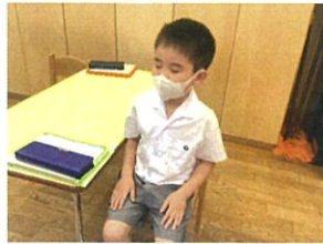
目を閉じて集中しています → マス計算も気持ち十分です!! 指先までバッチリです