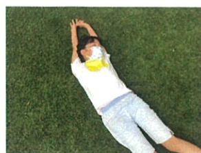
フカフカの芝生は子ども達ののんびりSPOTです