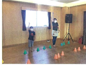
110先生と1対1の勝負!! 僅差で... 先生の勝ちです