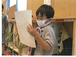
緊張で思わずウウウ... ですが、最後まで読みました!!