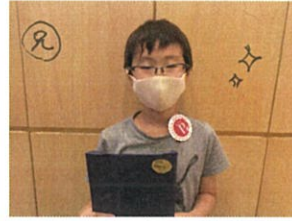
2人ともおめでとう♡ ステキな年を過ごしたね!!