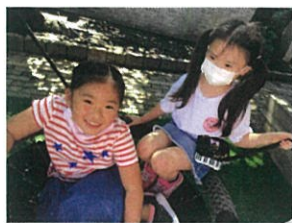
学年の枠を超えて月替わりも増えてきています!!