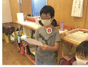
4月中にお誕生日を迎えます!! 将来の夢は... YouTuber!!