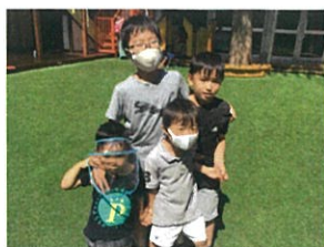
2組の兄弟でパシャリ画として1枚良しです♡