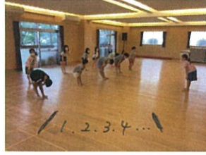
3階のサーキットが復活しました! 声を出して頑張っています!!