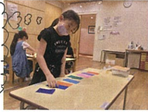
絵画ではちぎり絵にチャレンジしました!!