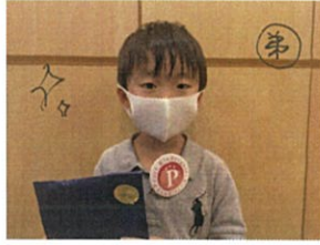
将来はサッカー選手になりたい!! そろそろ! 頑張るね