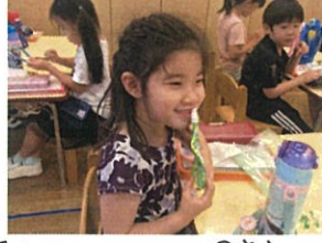
唇にくっついちゃった(笑) おやつの日曜明にもお祭りの準備