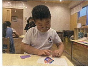
貼るだけでOK、ちぎる指先の器用さも重要です!!