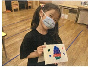
テーマは"梅雨"という事で、雨の傘を作りました!!