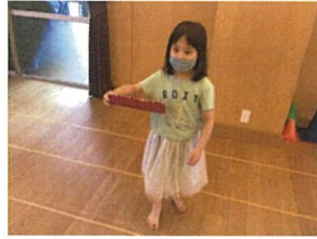
ドッジビー(材料戦!!) ...とその前に、まずはバス&キルキの練習からスタートです