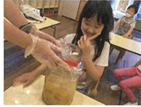
塩漬けしていた梅から白梅酢が出てきました...!!