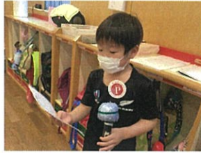
こちらは4月生まれのお友達!! 将来はパイロットになりたい!!