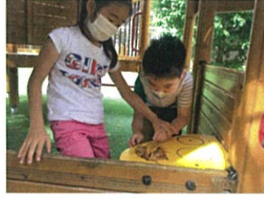
ダ・ヴィンチのHOUSEを作っています! 逃げないでと奮闘中(笑)