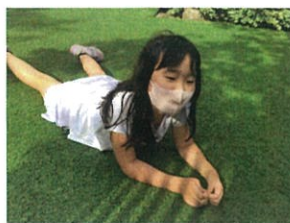
あつみのと 休読中...