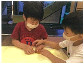
上級生が1年生に教えてあげる場面も...