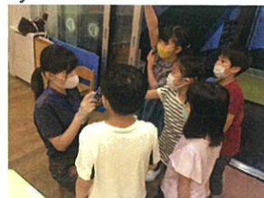
折り終えた後は、なぞなぞ大会! 大盛り上がりなみなさんです(笑)