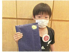
そろそろ! 頑張るね!!