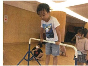
鉄棒や、鉄棒を掴んでまじえ