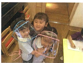
密です!と言いながらも 3人でキョーっと◎