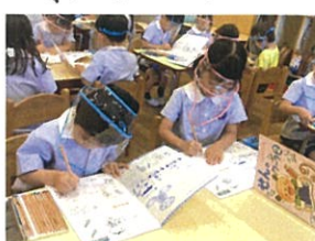
「せんワーク覚えてるかな??」 左手でワークをしっかりと押えてね