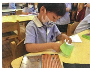
何を書いているのか、 ナイスです...◎