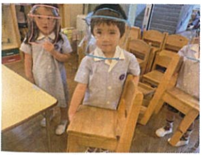
おイスも自分で運べ やうだから◎