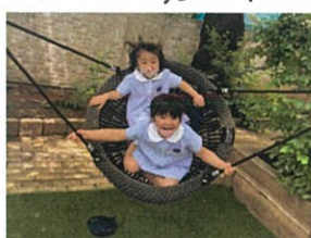
久しぶりのゆりかご スイング楽しそう