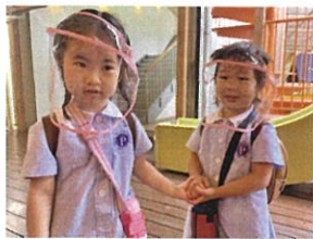
2人仲良く ご挨拶してくれました★