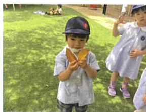
わあ!! とっても大きな葉っぱだね◎