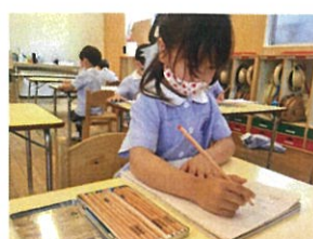
ひらがなの練習中!! とっても真剣です◎