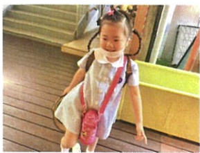
年中さん初登園!! スキな笑顔で登園です◎