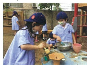
久しぶりのお料理場で お料理中!!