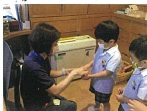
お誕生日、おめでとうござい ます!!