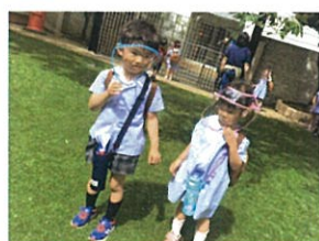
「妹と一緒に登園」 おはようございます!!