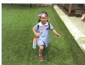
「ルンルンで走って来て くれました!!」