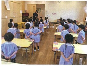
歌の姿勢も とっても素敵♪