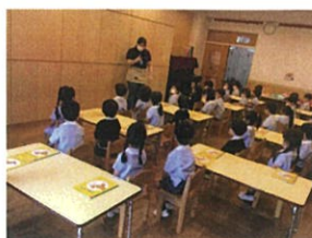
ようこそ、ガーネットクラスへ