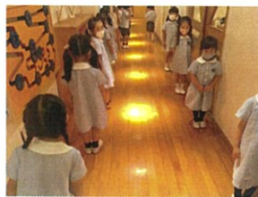
トイレの並び方も 間隔をあけています!!