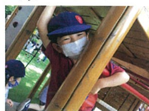
写真を撮って二後ろから、 よ〜!!と見せてくれました!! 「ぼくはココで〜す!!」と登場!!