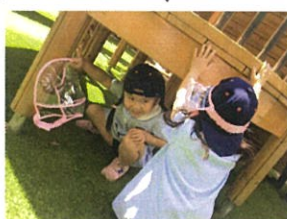
「あつ!!OOちゃん、 お〜つけた!!!」