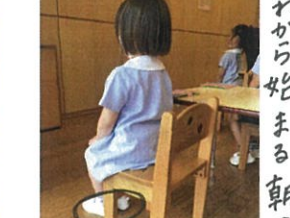
これから始まる朝の会。 二れから始まる朝の会。 「腰帯だけでなく、 足の表もついてます」