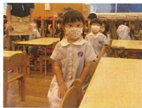
おめめパッチリ◎ キラキラビームを送ってくれます◎