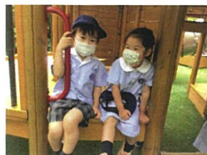
ツリーハウスに座って おはなし中。カワイイ