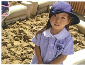
「お返ごができたの◎」 とお話してくれています!!