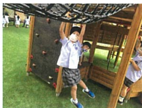
「先生行くよ〜!!!」 勢いをつけてSTART