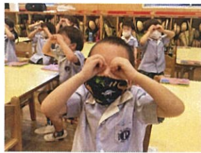
メガネをかけて 何が見えるかな?◎