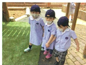
3人で手を繋いで 仲良くお散歩だね◎