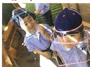
フェイスシールドをしてると キラキラ光るんだよ!!