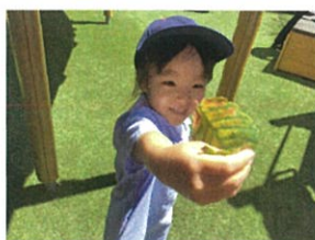
「先生あげる〜ナ」 スティキなプレゼント頂戴した。見つかっちゃった!!!