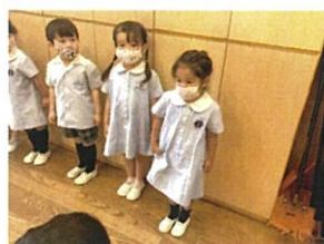
ガーネットクラスになった33人のお友だちに 自己紹介をして頂きました!! ドキドキ