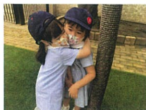
お友だちとギュー