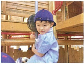
ツリーハウス大好き◎ 「僕ここから落ちない...」