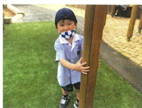
「ぼくのこと捕まえて」 ごらん!!と追いかけ二開始!!