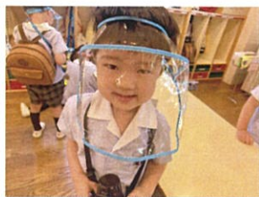
フェイスシールドがこいい〜♪