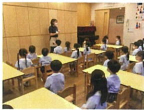
2ヶ月間のフライングを感 じさせない見事な立腰!!