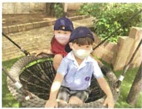
「一緒に乗ろう〜」と2人でゆりかごスイングクク 押ししてもらうのをずっと待っています(笑)