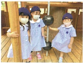
早くツリーハウスの2Fに 登りにい!!のお顔◎