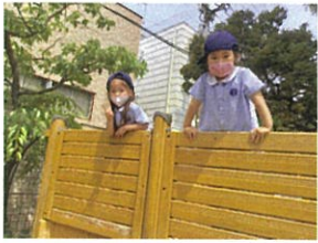
「やっほー◎」 密会現場に突撃!!