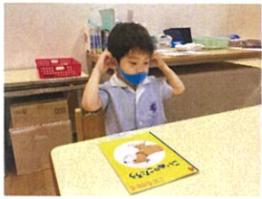
青いマスクが とってもお似合い♪