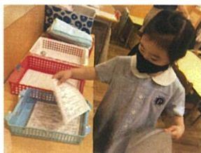
持って来てくれたお手紙も、ファイルから 出して種類ごとに提出するよ〜見入れてお返し 1年間、宜しくお願いします。間隔を開けて並んでいます。