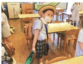
「重い〜!」と言いながらも 元氣張って持ってきてくれました!!