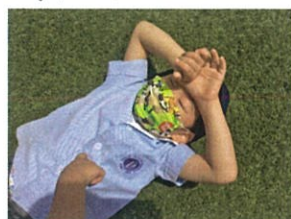
気持ちよく寝転がっていた 所を、フンフンされ...「?なに〜??」