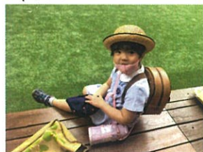
「クラスキャップに名前 書いて持って来たよ〜!!」