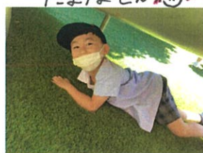
「あ〜!!隠れてたのに 見つからちゃった!!!」