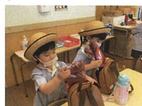
届いたPTシャツを 1つにまずは返事を揃えよう!! リュックの中へ!!