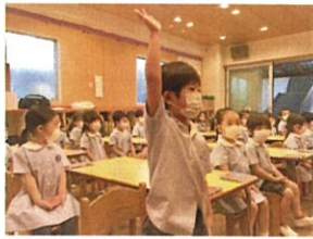
「はい!」とお返事してくれました!!