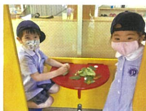
「お家ごっこしてるから 来ちゃダメ〜」と... (笑)