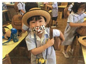
お話ししながらも... 支度の手は止まっています!! 甘えん坊上手です