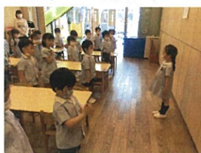
みんなの気持ちも