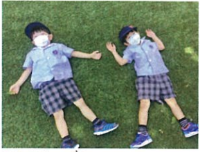
お天気の良い日はフカフカ な芝生で日向ぼっこ◎