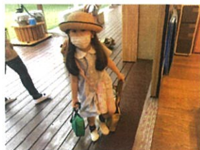
「おはようございますよ」 荷物がいっぱいなの〜