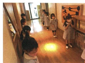
こちらはトイレの列です!!