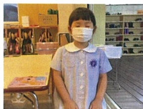
静かよ音を聞くのもとてもステキ★ 朝の会の準備もパッチリです!!