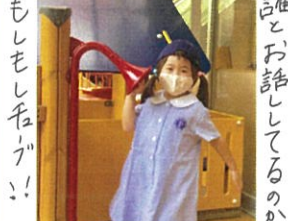
もしもしねが!! 誰とお話しているのかな? あ!! お返ごの音がする♪