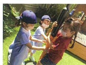
お友だちに回してもらい ながらクルクル回転!!