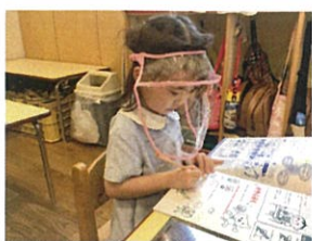
せんのワ〜ワ とっても真剣です!!