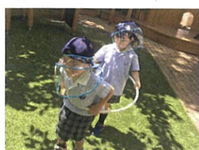
「電車が通過します〜 馬車を探してます」