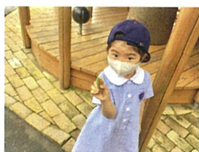
葉っぱをいっしょに拾って得意げ◎ 「先生葉っぱたくさんあったよ〜!!」