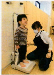
5月の 身体 測定