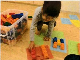
ブロック遊びの色々を少し紹介します☆ パズルみたいにしたり、好きなものを作ったり