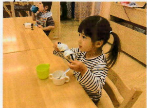
夕オレがリボンに変身~!!