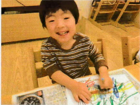
ぬり絵にもその子らしさがたくさん♡ 大胆に好きな 色でぬり、丸をキリにぬり... ♪個性がわくわく