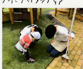
5月の目標の"挨拶"が 実践中です~!!