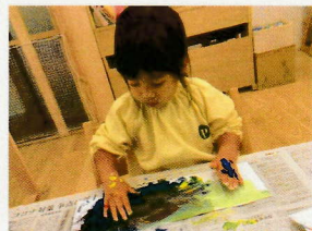
のびのびと楽しんでか できました♪