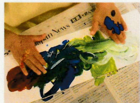
今度は両手で豪快に♪ だんだん慣れてきましたよ