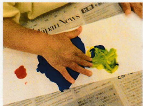
最初は人差し指で 混ぜり方を楽しんで...