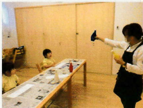
えのぐあそびをしました♪ 色クイズをしたあと...