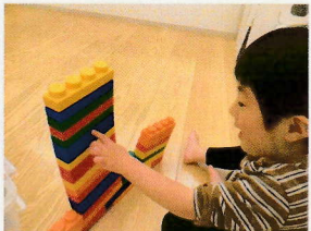
高く積み上げて 押してみると...