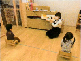
「おはなしのあおむし」が 思わずあおむしと同じ視線に... (笑)