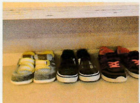
履物を揃える... 靴の向き、要checkです