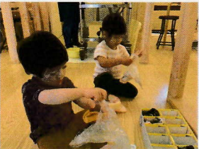
「自分のことは自分でします。」 できることが増えると喜んでくれます