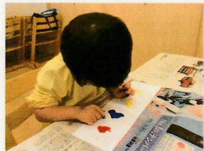
おそろおそろチャレンジ やってみよう