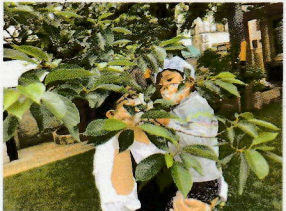
自谷先生と さくらんぼも発見☆