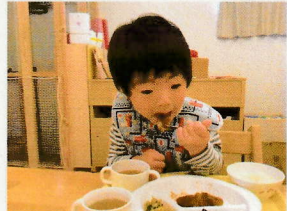
この日のメニューはとんかつ。自分で噛みちぎって 食べるようにしてみました。美味いね♡