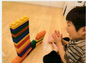
クラクラなバランスゲーム にして楽しむこともありです。