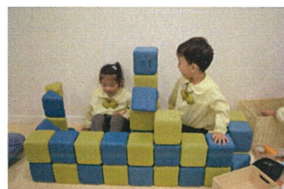
ブロックでお家を 作ったよ台