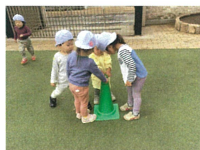
さて、このコーン誰か 片付けろ?! 相談中(笑) みんな片付けたい…