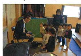
園長先生に挨拶と お礼を伝えています😊