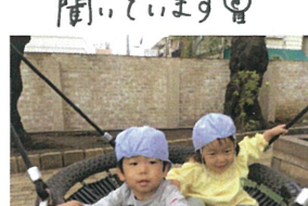
ほくものってけるクッ