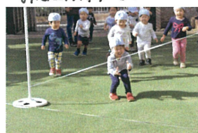
ゴムはわざとぶつめにして どこをくするかは自分で 決めます😊