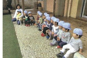
先生の話を真実に 聞いています😊