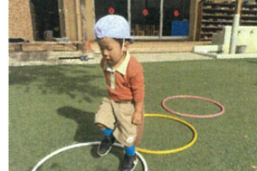
ジャンプするとこころ… 歩いた? (笑)