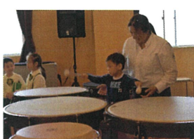
ほくほくの音がいい〜クッ 真矢にテンションに 向かいました(笑)