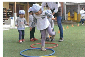
次は片足で!! ケンケンと跳ぶことが できます♪すごい♪