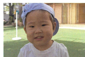
カメラを持っていたら 「ナエにナエに〜?!」と 近くにきてくれました♪