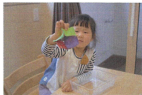
全部のひげることか できました😊 「みてみて〜クッ」