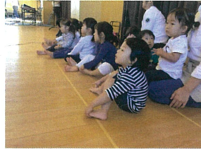
音舞台の練習も 見学中…真剣です!!