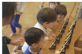
幼稚園の玄関は クリスマスに 陶器など貝殻だけ…真剣(笑)