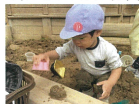
おあい〜クッ上手に 型抜きできたね♡