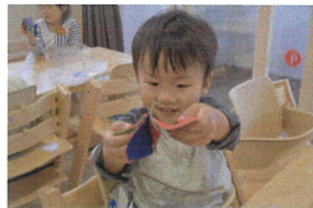
ボタンの知育あそび パチンッとできたエグッ