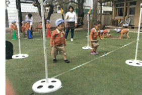
幼稚園では便利転練習で 使っているゴムです! こころは ジャンプしてくらたりにます😊