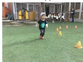
コーンの回りは ダッシュです!!! はいて〜クッ