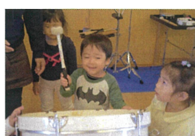
特別に楽器に触らせてもらいました!!!!!! 先生が叩くりズムに合わせ 大だいこ叩いてます😊