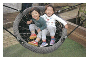
すこいいい笑顔こ