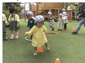
走るこよりコーンの 上を歩きたい(笑)