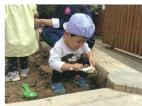
ほくほくはこい人 つくろってクッ