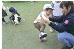
こっちでも練習中かな? 片足あげるの上手!!!