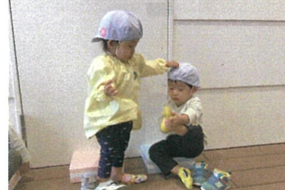
園庭あそびに行くと く履けるかな?!