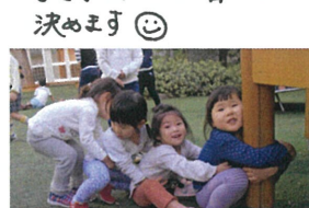
大きナカぶ さー板けるかな?!