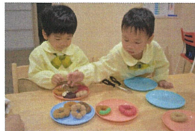
じめドーナツに しょうがは〜クッ