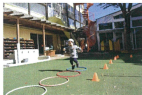
両足揃えて ジャンプ!! 上手にできるよになっね!!