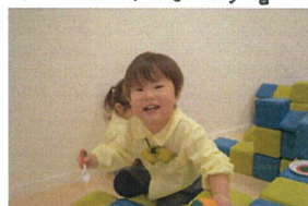
にっこにこど楽しんで 何を作るのクッ?