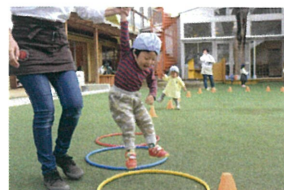
先生のガを借りて ジャンプ★★