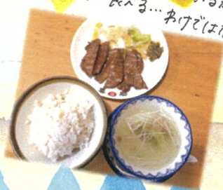
仙台に住んでいるからといって よく食べる...わけではないです(笑)

2学期になるとパール幼稚園の三大行事 である「FESTA」と「音舞台」が待っています♪ 私にとっては初めての行事ですので今から 緊張とワクワクと...色々な気持ちでいっぱいです。 子どもたちにとっては全体的に短い「最後の」 という前置きがついてきま可々。これから楽しんで 全力で取り組めるよう、私も全力で子ども たちと向き合って参ります!! そのために... 私からルビーさんに伝えたこと。それは、 諦めないこと。周りのお友だちと比べて しまうことや、上手くできないことも出てくるでしょう。 しかし、決して諦めないでほしいと思います。 そして何より、諦めず、そして前向きに 物事に取り組むこと。強い心が 育って来たらしいです。思っております!