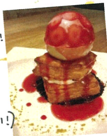
イチゴパイが美味しかった!

ここで少し私の夏休みを... (興味ない!) とおっしゃる方もお付き合い下さい(笑) この夏は旅行に行ったり、もう1ヶ所旅行に行く予定だったのに見事台風に負けてしまったりと波瀾のある夏でした。結果、ゆっくり出来たので良かったです。(暑気は相変わらず暑い)