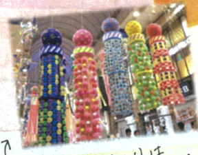
↑ 仙台での七夕まつりは 10月過ぎの8月なんです!!

4月から毎日行っている朝の会。 1学期を振り返ると、できるようになって ことや揃うようになってきたこと...だけれどよく、よくできる ためにもっと伸ばしていきたいことやまだまだ合わせていきな ことも明確になってきたように感じます。例えば採算と お返事は8月号でも書かせていただきましたが「着払い変化 として挙げられま可々基本的なことだからそそ疎かにせず、 徹底していきたい」と考えています。また、お話を聞く姿勢 はまだまだ頑張りたいと思うところ。目と耳だけでなく 心も動かすように一つひとつお話を聞いてもらえるよう にし、子どもたちとの信頼関係を 深めていきたいと思っています!