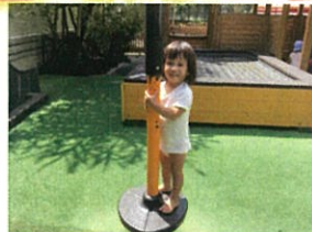
せんせー!! おいでしよう!! 一人ご出来だよ