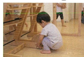
あそびを発見!! イスとイスの間をいれ、ブロック 積み木を転がして遊ぶ。