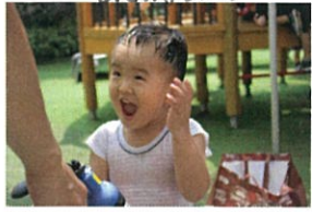
先生!! もっとお水かけろ!! お顔にかかってもいいよ!!