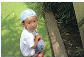
ボクは虫さかし... ここに大好きなダンゴ虫が いるぞうだ...