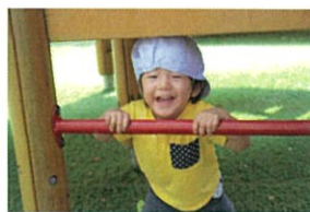
そんな所に居るの?! 涼しい場所を発見!!