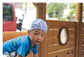
スパイダーマンみたい!! ヒューン! ヒューン!! 別びハネルエに移動中!!