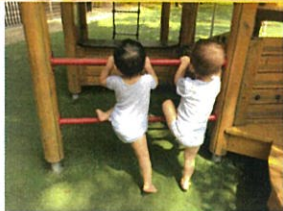
二人とも同じポーズ!! かわいいですね!! ひたひた!!