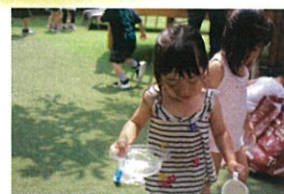
とても真険はお顔 上手く持てない... ニぼれる?