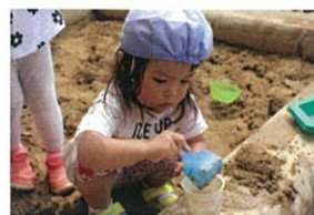
ママにゴ飯を作って あげるの!! と真険め。