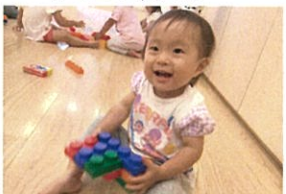
ブロックの組み立ても 上手になりましょ!!