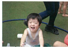
ボク、お水あそび 大好き!!