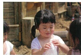
トイボックスの入れ物に お水を入れて... 水あそび!! 準備中だよ!!