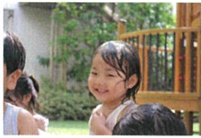
キョー!! 私はずけはき!! 「二の中に入れて...」 「いいよー!!」と関わりも増えていまる!!