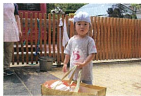
最後はお片付けをし ぐれありがとう!!