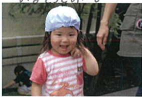
先生、ひとりひとりに... アリさんが居た事と嬉し そうに報告...♡