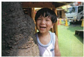
せんせー!! ビックリした!! かくれんぼ中でした!!