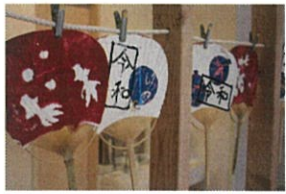
令和元年の「うらわ」!! 自分たちでレイアウト... いい味が 出ていました!!

2019.7.29 MON ~ 8.3 SAT お水あそびがピカピカの暑い夏がやってきました!! お着替え袋にオムツとタオルを入れて下さい!!