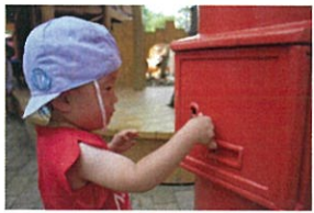
カギ穴を発見!! ちゃんと 枝をカギに見立てます!! NICE PLAYク