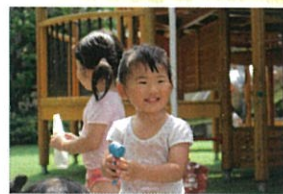
今日はお魚さんごあそびの お水あそび、きもちいいネ!!