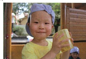
麦茶がおいしい!! 先生もどうぞ♡