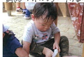
くつ下... ボク、おんぼこ います。むかしいけど... やる!!