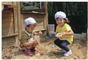
ボクは私に... お砂あそびも大-好きだよ!! 今日は何を作ろうかな?! お友だちに教えてもらえばわり遊びが展開していくことも...