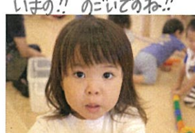
見てね... と変顔コンテストが 始まりましょ!! 1人 の内側のカラダパチリ!!