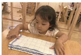
先生のお手伝い 半分に折って... 合わせ...