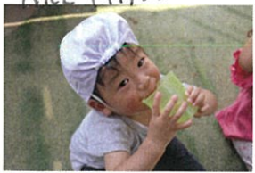
たっぷり汗をかいたから 水分補給もしっかりと!!