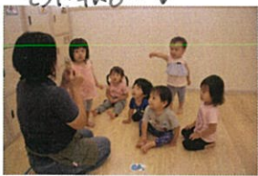
絵合わせカルタ!! 動物の名前もたくさん覚えよう