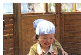
トランポリンでダンス中!! インストラクターだよ!!