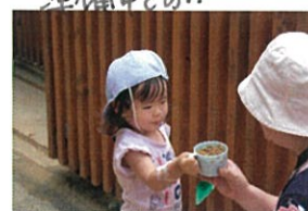
大田区の巡回の先生にも 「どうぞ!!」とおもてはし!!