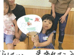
素敵なうちわが完成しました