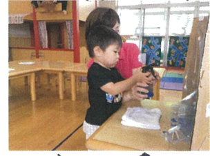
グルグル書いてビックリスズーヌ由 4と2と4ヨル書いてアイス白 スプレー絵の具でシズツシズツ