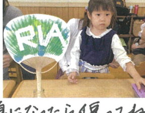
夏になつたら便利だね!!