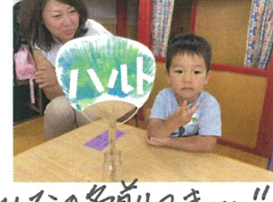
みんなの名前つけき...