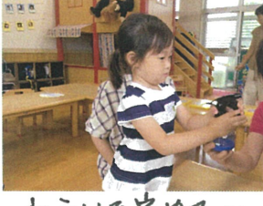
かわいいを定めよう!!