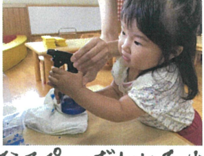
大きなスプレーボトルを小さいのが持つのが大変だったね