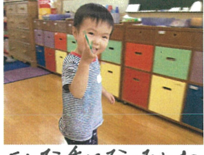
みんな手になつたね!!