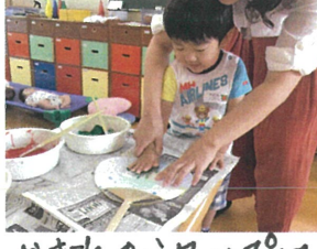
かき氷のシロップはみんなのかわいい