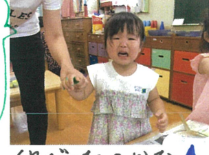
いやだったのかな