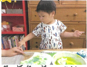
水色、黄色、黄緑などの3色を混ぜて作りました。