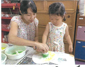
大きなタレポを持つ...