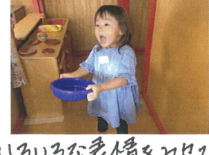
いろいろな表情をみせてくれます。仲良く絵本を読みました。2学期に会いましょう