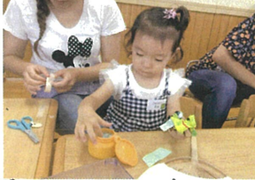
『かき氷』を作りました!!