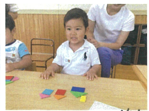
先生と同じ物をつくりましょう!! 「できた〜」の笑顔