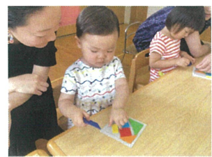
片づけは素晴らしいですよ!!