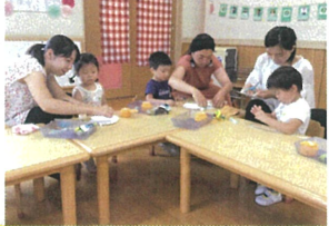
ママ達 真鍮」に作っています!! お手伝いも...