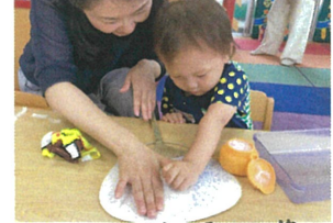
ママとの共同作業です