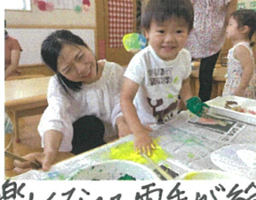
楽しくなつて両手が絵の具だらけ...