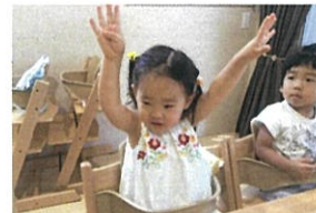
ちょうちょにアツアツ〜😊