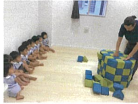
なんだ?! なんだ!?! 何かおもしろそうだ〜☆