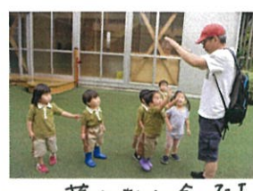
藤井さんに会ったよ😊 タッチして〜😊