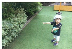
なまのこにアツアツ 気になるお菓子...