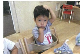
うきうきい〜 おおさんに変身だ! ☆