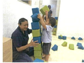
精一杯積み重ねて自分の背より高くなりました😊