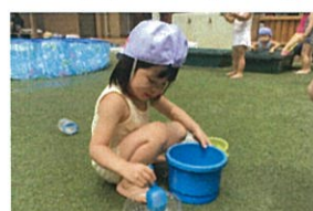
キャベツおもしろい! キャベツのありません!! (笑)