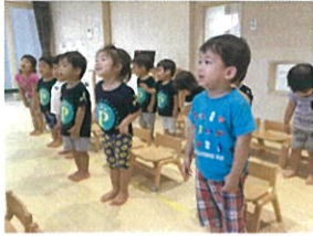
おっ!! 気を付けかいてるもかっこいい☆