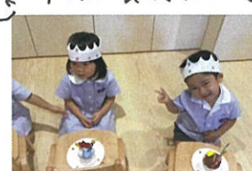
ケーキにフルーツをさ〜る特別なケーキだよ😊