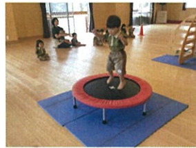
トランポリンも行いました😊