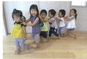
せうは続いよ曲に合わせてみんな電車に変身だ! ☆