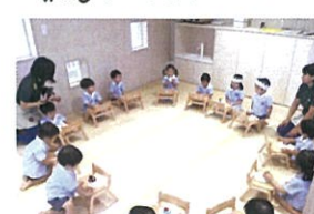
みんなじーいたまきま〜☆