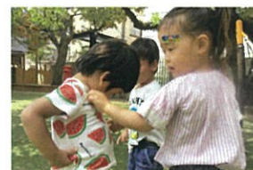
すい〜おいしい♡ 私にも食べさせて〜😊