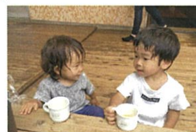
1歳〜おいしい♡ (こいこい遊んだ後のお茶はおいしい😊)