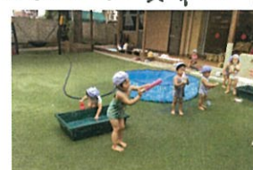
水鉄砲よく飛びます! もう使い方を覚えたね😊