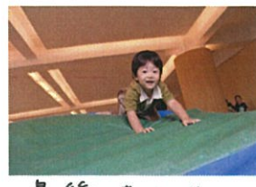
最後はお山!! ニコニコ降りてきました〜😊