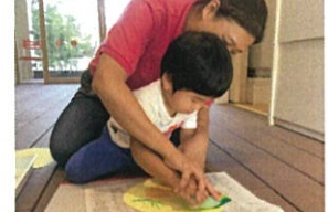
スポンジにえのこをつけて...えーい!!