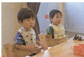
おやつ前にうちわ製作の話真剣に聞いています!!