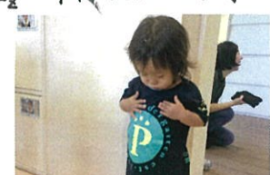
PのTシャツデビューです着ましたよ〜😊