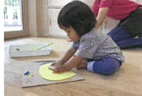
ハイナップルはんこ ハタ...と...どろろ感じかきか?