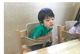
給食食べ終ったからぬいをはたかたに...😊