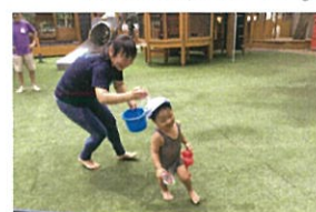
うわあ〜 お水のけらけらに〜げろ〜😊