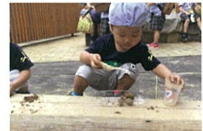
おいしいごりあんつくろあ〜 ☆