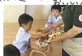
えーっと... フルーツをコレにする😊