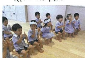
ハロワサートの始まる前のあそびはカレーライスのおやつ中😊