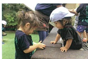
だんごむし見つけた! みーせーて〜☆