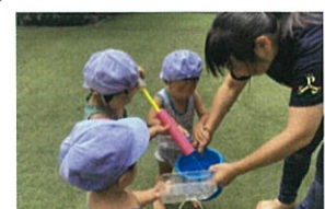
えーい、バケツにお水を入れて下〜い! 😊