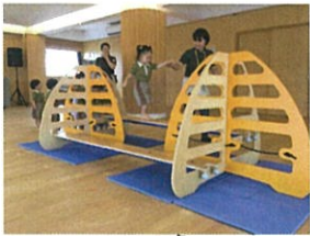
今回の体操は平均台です😊