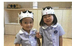
7月生まれのお友だちの誕生日の主役です☆