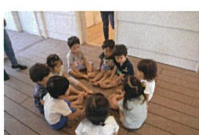
あら? どうしたの? 円になれます(笑)