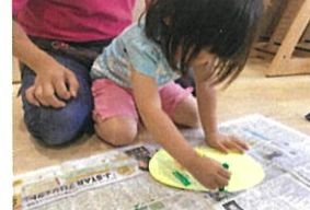
ハイナップルの葉をフクロで福まつき