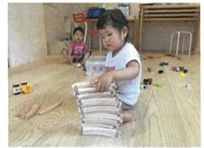
同じ丹々のレールをくずさないように積んでいます😊