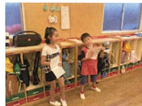
先生の代わりに 並べておいてくれました!! ありがとう(笑)