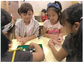
オセロもまたバダゲームですよ!! お片付けありがとう♡