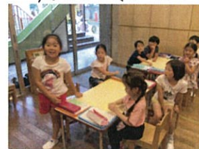
堂々としているのが いいですね♡♡