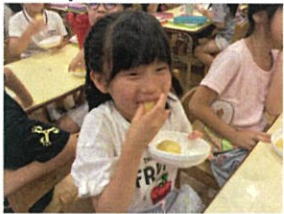
ほくっ♡ いい笑顔ですな♪