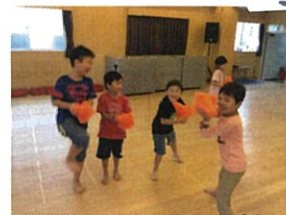
チーム、集合!! 何をしたのかな? →