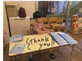
作文のフリート学習も行いました。 「うん...」 考えています 笛