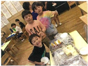
「おかわり、お願ひします!!」 元気いっぱい♪

1学期もありがとうございました。 夏休み登園と2学期も よろしくお願ひ致します!!