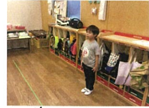
1学期日直 Last Day!! かこ(ハハ)♡