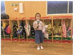
Happy Birthday♡♡ July 夏休みに 突入する前にお誕生日を迎えます♡♡