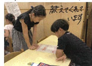
作文のフリート学習も行いました。 「うん...」 考えています 笛