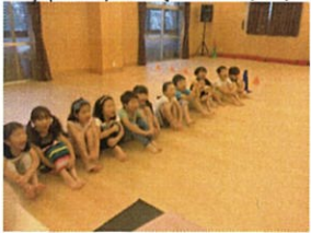
「がんばれん!!」 いつも応援ありがとう♡