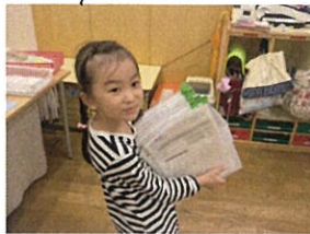
作文のフリート学習も行いました。 「うん...」 考えています 笛