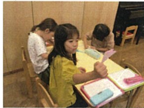
「うん。こんな感じで 良いかな? (笑)」