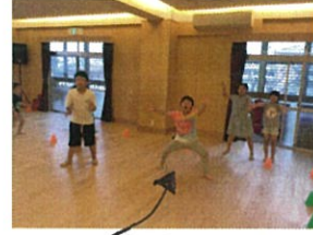
「当てていほん」と アロー(笑)