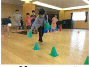
正解は?? ドッジボールを 行いました(笑)