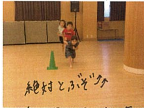
待つ姿からやる気を 感じます...