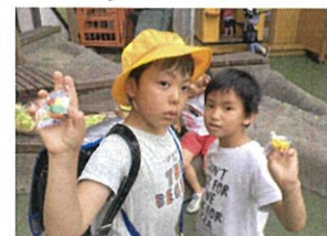
1学期 Get 笛