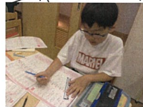
作文のフリート学習も行いました。 「うん...」 考えています 笛