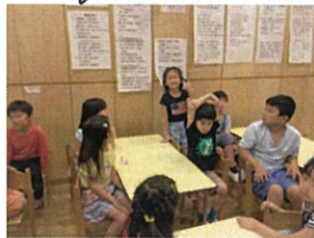
活動中、「ハイ!!」と 挙手してくれる子どもたち。