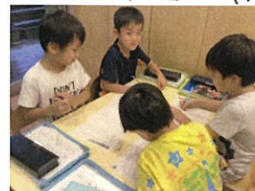
作文のフリート学習も行いました。 「うん...」 考えています 笛