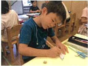
工作は、折り紙を 使って、切り紙♪