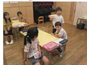
自分の考えを一生懸命 伝えてくれてます♡