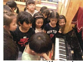
お友達の弾く素敵な 演奏にうっとり...♡