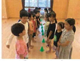
男子vs女子 いい単語でしたよ~ 笛(笑)