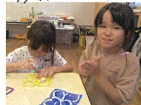
最後は、のりで ハッハッとくっつけて♡