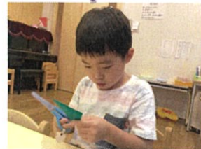
はさみは、ゆくり 丁寧におね!! 笛