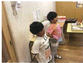
発声練習の お手本をしてくれています!!