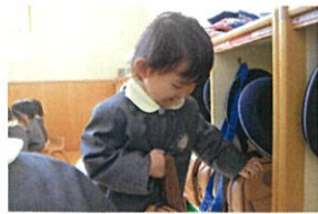
整えながらランリックをしまします。