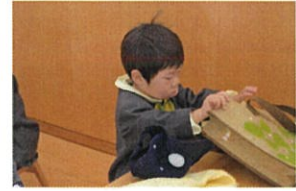
スモックとクラスキャップを…♡