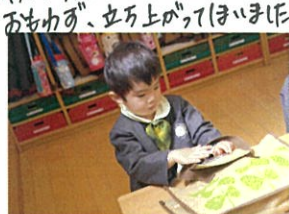
上手にしまり事ができました。 丁寧に整えています。おは!