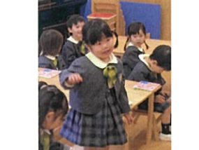
ちよとまだ取はずかしい おともたちも...それもよし♡