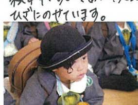
今日もヨヨヨ お帰りの時間です。帽子の前後が ちがう事もちやとお約束の表情もいいておは!今日もがんば りました!!