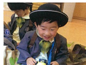
帰る前にニコニコ♡だと 先生もとっても嬉しい♡