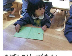
おにぎりばさみの中を確認しました♡