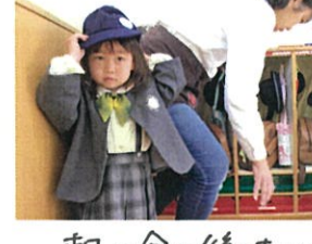
朝の会の後は…初めてのお荷物造り♡