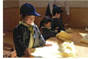
次はどうやって置くのが考えています♡