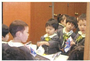
トイレでは、濡れはじょうに 袖をまくって、ハンカチを用意 してから手を洗っています!