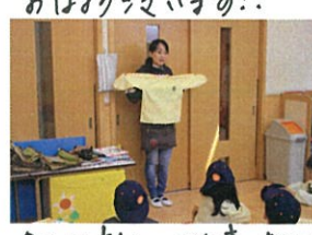
今日は新しいお仕事、おはも ぐりの日です。首に沢山 お願いのあります。とさか...