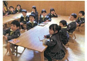
おたよりばさみを準備して アンパンマンの紙芝居を見ています。