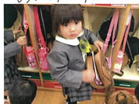
リュックを置かなくても おたよりばさみをしまえます。