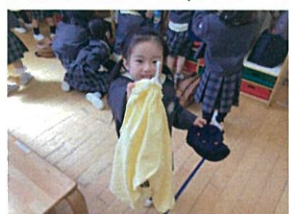
矢がはローローウスモック クラスキャンプを持ってきて...