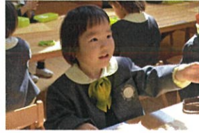
「見て見て♡」と作ったものを見せてくれました♡