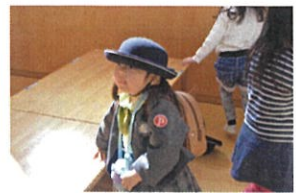
「ココが私の席!」ちゃんと覚えています。