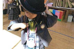
リュック・水筒・帽子…一人でチャレンジ!!