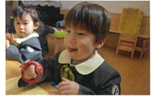
ゴムを、手首に付けるのも覚えて!