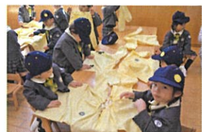
初!! お荷物造り スモックは説明通り 畳めるかな?