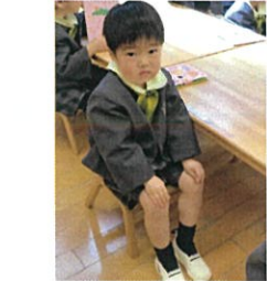
座る姿勢...指先、足まで 揃えていきたいね♡