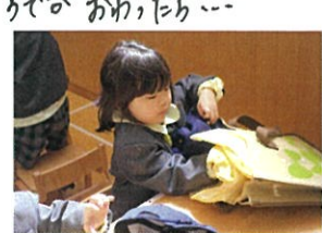
せかくたてんが"お荷物。 くがたないおにX、とね♡