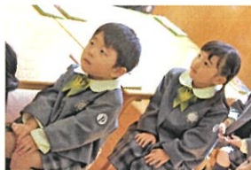
手はひざの上!! ちみち待ててくわて います♡