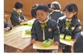
お片付けも、スムーズになってきましたね!