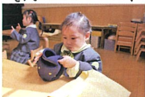
クラスキャップのうばは 中に折り込めます!! できちゃかな?