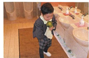
登園したら、まずはおトイレ チキ洗、ティ、ハンカチで しゅわしゅと手を拭きます。