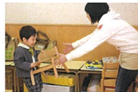
1人の持ち方を覚えて 運んでくれました♡