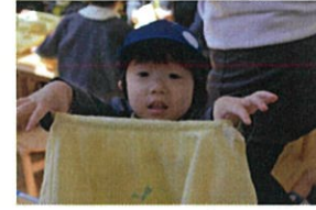
「どっちが前!?!」→「ポケットがある方がよ!」