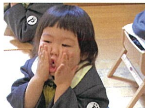
「しほんぶちゅ〜たよ!」と 伝えてみました。