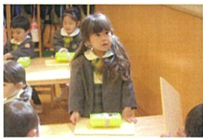
今日も朝の時間は粘土で 遊ばました♡