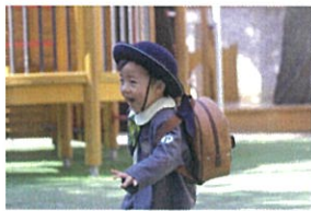
ママにいつまでも！おした後はダッシュ！玄関で 待っている先生達にも元気いっぱいにご挨拶。 今日も元気に来てくれて、ありがとう♡