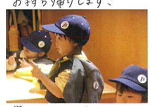
葉っぱからたから、 思いつく立って持ち帰る♡