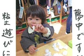
粘土遊びに夢中ですよ♡