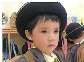
よし! おうちに帰ろう! というお顔かな?♡