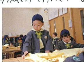
最後は人にちほ。で半分。 イスに座、たヨリではできず、 おかわり、立ち上がってほいましてが