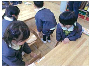
イスは並べ直して下マシ。 お約束、ちゃんと守って来ています。