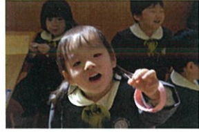
「うびんができたよー!」と教えてくれました♡