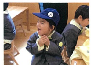
お荷物造りをします。 スモック・クラスキャップを お持ち帰ります!