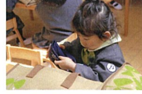
クラスキャップの「ギョウザ」作ってます♡