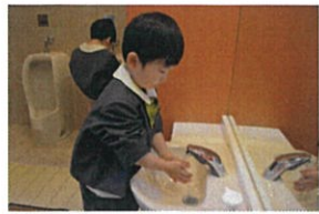
トイレの後は手を洗います。上手だね♡