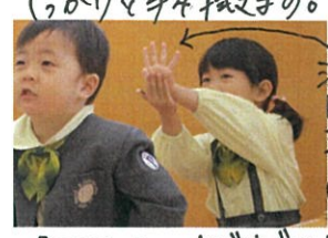
100万人、ニハだけできる！ とほりこつてくれています(笑)