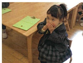
あっ! (ふんかいけいがないこと 言っちゃった! (のかな?))