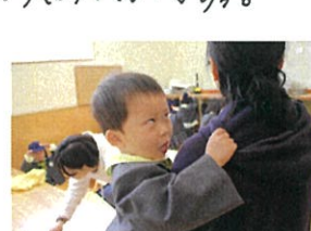
えっ!? 先生の見えないうつで 二人な顔して下の??? Nice。ふかひの大好きです♡