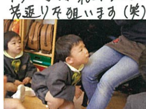
"あぐへく近くで見たいの。 絵本中かあ、あぐを先生の ひざにのせてほいます。