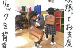
リュックを背負います♡ 頑張り、お支度できたね! ケーブルです♡