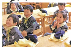
スモックでクラスキャップが 畳めたら、机の上に セット!