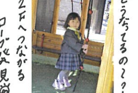
2Fへつながる ロープが見える どうなるの??