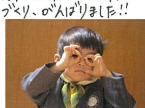
新枝のXがX。面白い事は ぐに出来る様になりました♡