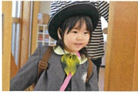
「おはようございます!!」 ニコニコで登園ク

4日間の个置し孝育活動が終了しました!! ものすごい勢いで、新しいことを吸収しているトパーズさん♡ 4日間でも大きな成長をみせてくれました♪ 来週からは益々楽しみです♪