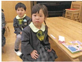
今日は涙もこらえて...! ステキでたくさん頑張ってるわ!