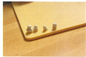
こんなに小さな 重なるまたさ♡