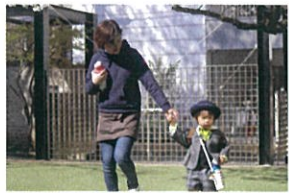
大好きな小林先生とチキ つないで登園。おはようございます！

4日間、沢山の初めてのチャレンジ しました。本当によくがんばりました 入園の日、お待ちしております。