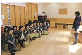
お土産が来たら... お礼の交換です♡