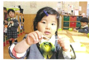
私は細長く 伸ばしたよ!!