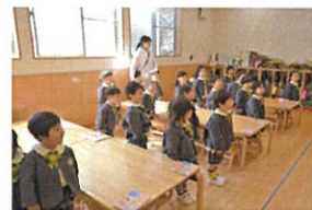
さあ、今から大事な お話ししますよ〜♡ 「気を付け」はできるかな?