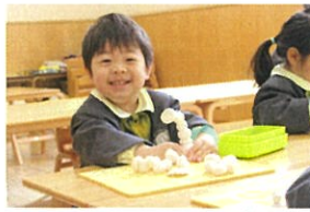
見て見て!! 粘土を たくさん重ねたよ!!