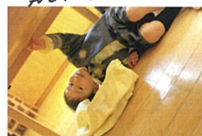
ゴロりん♡ 風 になっちゃいます(笑)