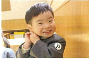
「お前、たうジかいうせだ!!」 と、ティッシュで手を ふきふき(笑)