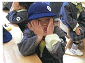
×ノウさんは真似っ名人か? タラ〜みだいですね♡