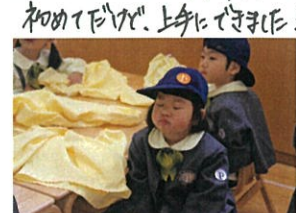
うへん。こんな表情も できぬ。のわい♡