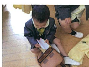
あれ!? おはもつぐり中か リズムの中の連絡係が急に おとなりました(笑)