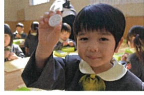
レモン!? ミカン!? とってもオイシイ♡