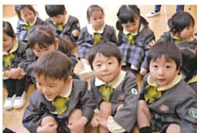
先生の戸口に集まっ... お山盛り、できちゃかな? 一番前の席をゲットです(笑)