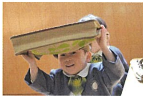
あれ? 頭にははめないで 下さーい