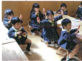
陸る姿勢の指先を みんなで作っています。