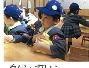
自分の机に持って来ます♡