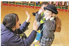
藤コースさん、一足お先に 「さようなら♡」