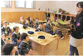
それではこれから ザグバックを畳みます おしてはおひさ!!