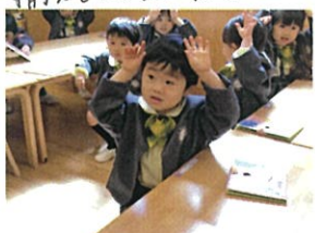
パーが可愛いくて、 うさぎの耳にしてみました♡