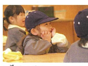
次は何するのかな〜! とワクワクしているお顔♡