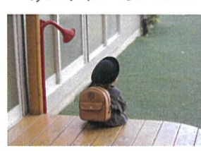
黄昏中... それでも良いです♡