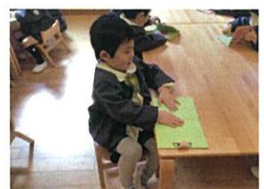
おたよりばさみを開くのも4日目。 机の端に置いてあります♡