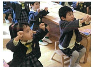
「グーチョキパーで」 遊んでみました♪