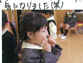
今日も大好きな体操をしました!サンゴメンは本当に 1りがよく、私もついついほりこつてほいます。 若返りや組みます(笑)