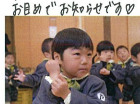
最後は仕上げは上げき袋を しゅわしゅ。初めてのお荷物 ぐり、がんばりました!!