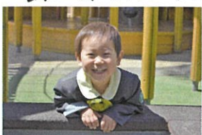
園庭あそび日!! とびきりCuteな笑顔、 いたたまりました!!