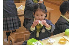
と〜っても夢中になっています♡