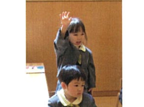
右手を挙げて、「はい、00です。」 もうバツリです♡