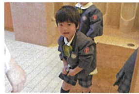
ハンカチ、ポケットに入れられるかな??