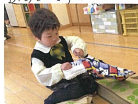
上履きもお持ち帰ります。 両手器用に使っていますね♡