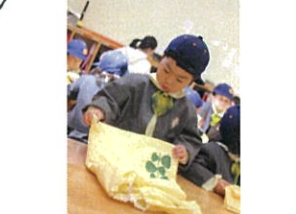
さあともなく仕上げです。 うでが"おわ"たら...