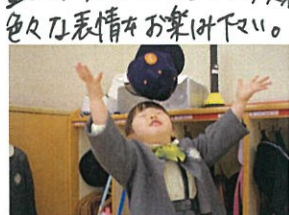
クラスキャンプを投げたはキャッチ 楽しかったです!お荷物ぐり中。