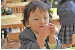
粘土をじ〜っと 何のクチに見える かな?