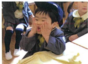
可愛いお顔 3連続♡ 先生の真似をしています。