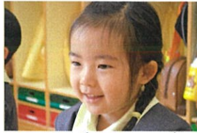
お友だちのあそびを 見るのも楽しいね