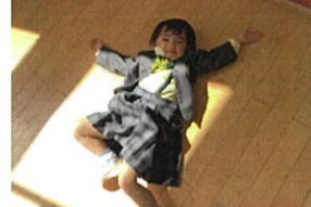
「あったか〜い♡」とゴロリ♡