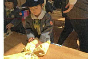
まずは、スモックを置いていきます♡