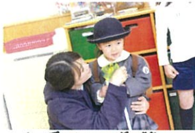
登園後に突撃 インタビュー(笑) 「今日の朝ごはんは??」