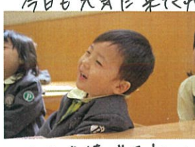
こんな表情で反応してくるサンゴメン。もうのわかって のわかってたヨリヨセ人。竹内先生、ほりこつ、ちやいます！