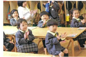
手をあそびの 笑顔にさ