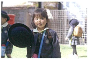
ママと門のところでバイバイ♪ 元気に「行ってきまーす!!」