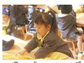
丁寧に...「ママにお洗濯 お願します。」の気持ちを 込めています♡