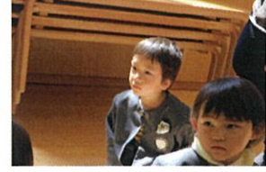
絵本を真剣に聞いてくれています♡