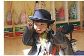
帽子のゴムを耳に掛けたらOK!!