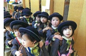
最後に「電車」になってクラスをお散歩♡