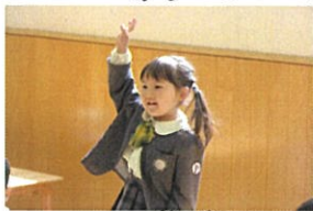
クラスが一番最初に 呼ばれます♡ とても上手なお返事です!!