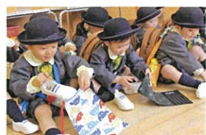
一足ずつ... 上手に しまえるかな?? 一人でできたね♡