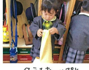
クラスキャップとスモックを♡