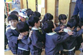
電車になって、トイレへGO!!