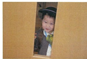
クラスの前扉の小窓 からニコリと見えています。 おはようございます！