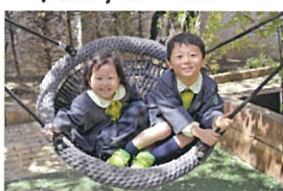
2人で仲良く 揺りかごスウィング♡