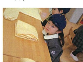
できました!の合図は 今はおひま。Xしてキラキラ お目めでお知らせです♡