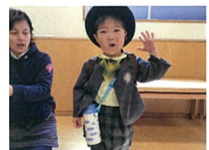
じゃあ、また明日!! 入園の日、楽しみだね♪