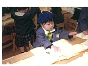
机の上にながして、おきて パタンパタン...