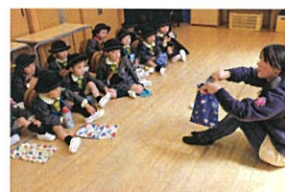
最後は仕上げに 仕上げをします。