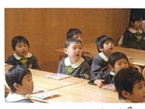
先生の方を向いて話を聞く姿... 先生とっても嬉しいです!