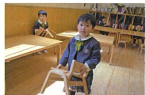
ぼくだしてきるとク バツリです♡