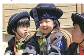
あれ? 帽子が2つ!! オシロさんです♡笑♡