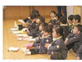
帰りのお支度をしています。 「ママが作ったの!」と 上履き袋の自慢大会でした♡