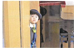
ひよこ♡ 2便さん 「おはようございます」