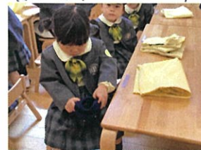
次はクラスキャップを畳みます! ギョウギにね!と伝えてます!