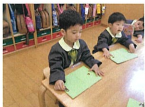
「お手紙ないよ!」と伝えて くれるおともたちの姿も♪