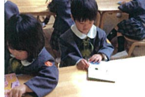
「おにぎりばさみ」の準備もイカたね♡