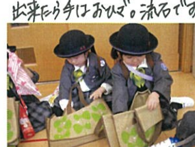
両方の上げき袋 一度に入れるのは 多量以上に難しゅう。 今日には上げきも持ち帰りです。 初めてで、上手にできました!