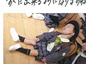
寝ている訳ではありません。 寝てワ。何故!?今???