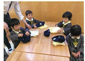
先生に届けてもらいながら 自分でやっています♡