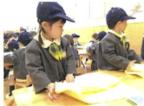
スモックを自分で畳みます。 ちゃんと考えながらやっていますね!