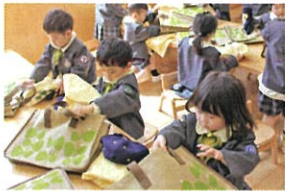
自分でしまいます。 きれいにしまえるかな? がんばれ〜ク