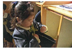
帽子は、小さいゴムをロッカーに掛けています。