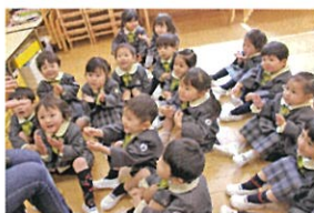
投げキッス♡を みんなにしてもらいました。 かわいすぎ〜♡