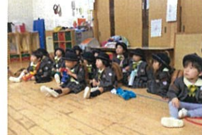
大好きなアンパンマンの秘密居に夢中ですよ!!