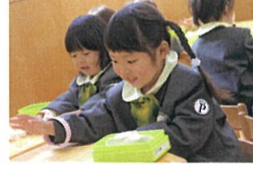
ず〜と粘土で遊んでいます♡粘土人気!