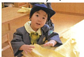
ぼくも上手に 畳めるよ!!