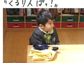
クラスキャンプのセットもおわり、 いよいよ最後のお仕事です。 出来たら今はおひま。泳ぎです♡