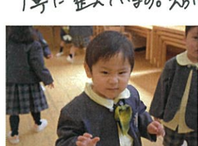
さあこの日はとっても個性 豊かなサンゴメンの面白い写真集。 色々な表情をお楽しみ下さい。