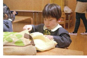
「ピザ」を入れる様にそ〜とサグバックへ…♡